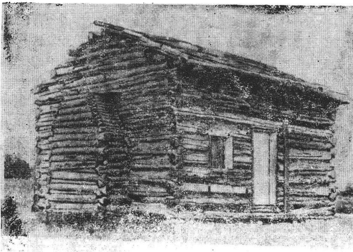
林肯出生的小木屋

二十八岁的托马斯·林肯于1806年6月12日在华盛顿县比契兰与露西·汉克斯的女儿、二十二岁的南希·汉克斯结婚。婚后，