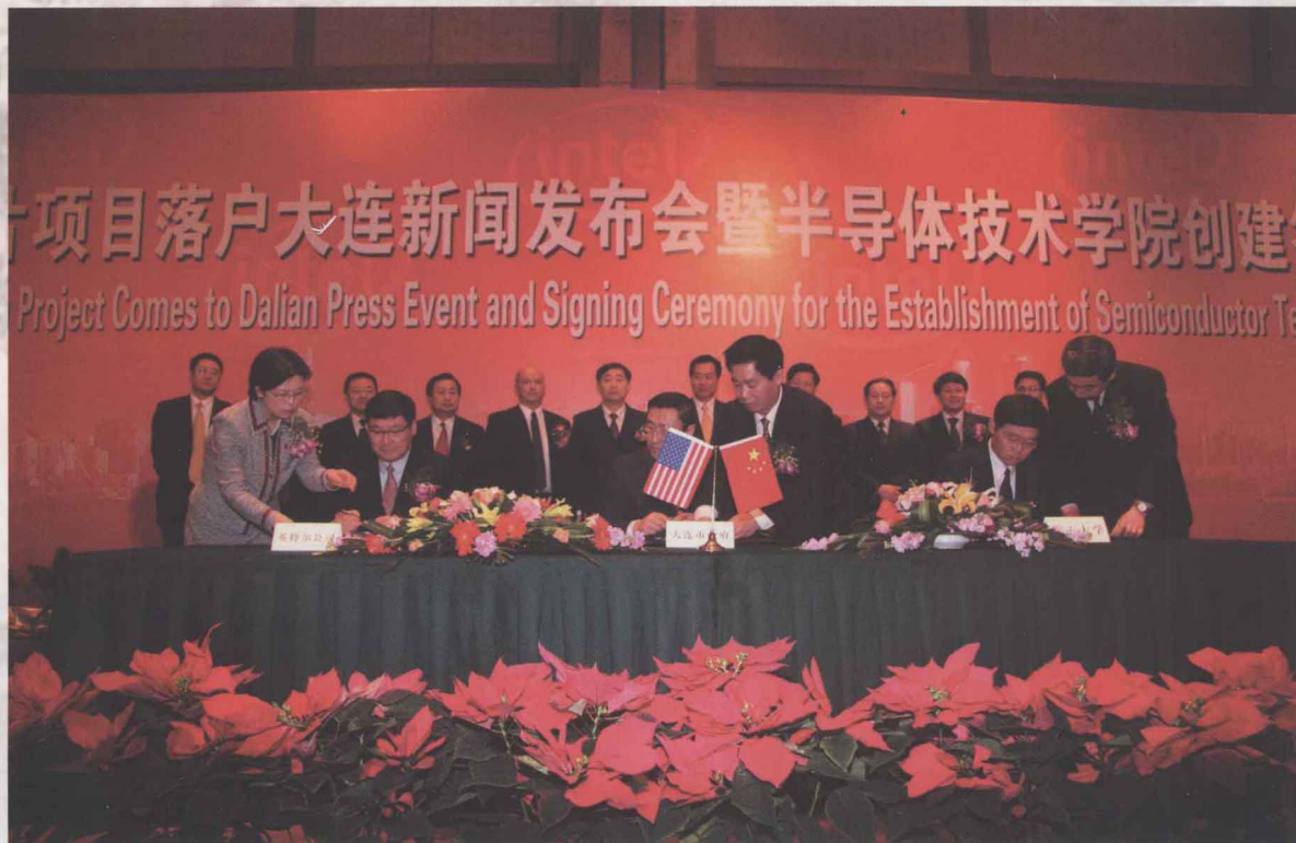
3月27日，英特尔确定在大连建立12寸晶圆厂后，大连市、大连理工大学携手英特尔签署协议，共同创建半导体技术学院。