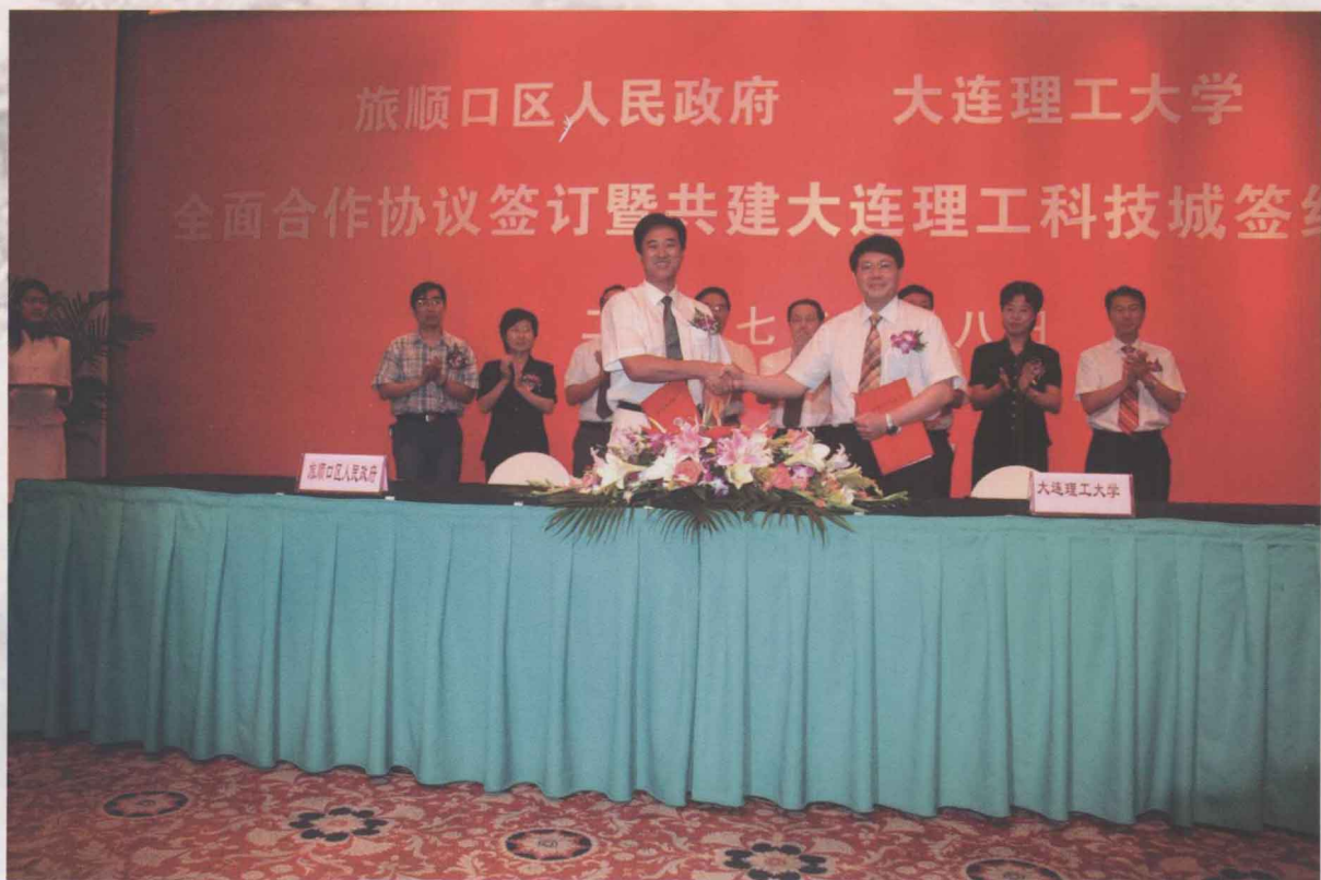
8月8日，我校与大连市旅顺口区人民政府签署全面合作协议，旅顺口区与我校技术转移中心共建大连理工科技城签约仪式同时举行。