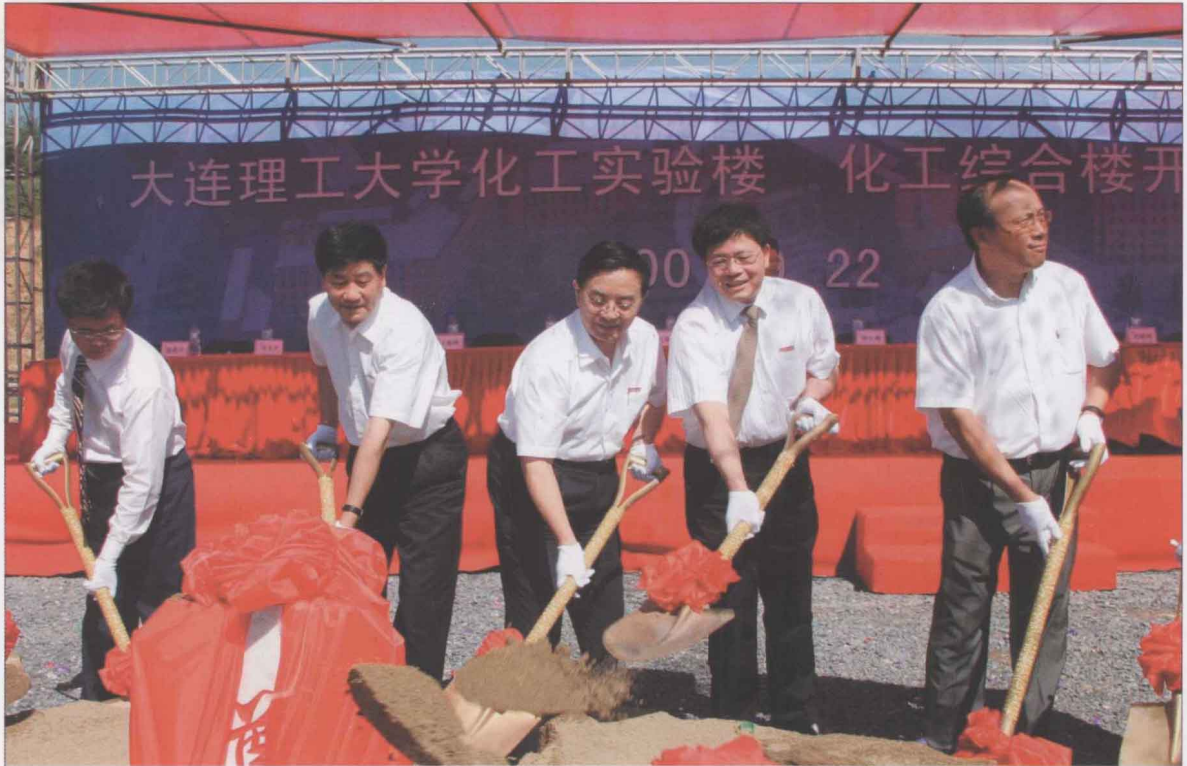
9月22日，西区新征土地的化工实验楼和化工综合楼正式动工，标志着我校西区大规模建设拉开了序幕。