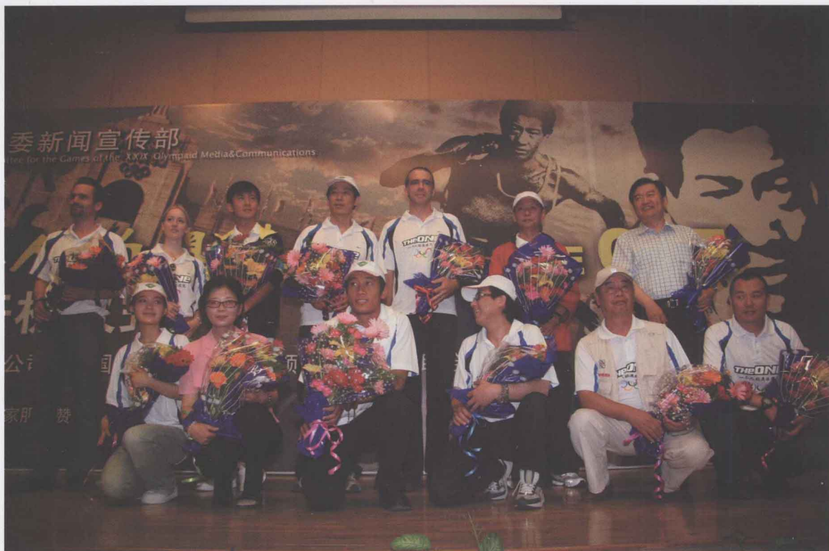
6月16日，电影《一个人的奥林匹克》在我校开机，这部影片表现了以刘长春为代表的中国人，为实现奥运梦想所付出的赤诚情感和艰辛努力，全片洋溢着浓烈的爱国主义情怀，自强不息和奋力拼搏的奥运精神。