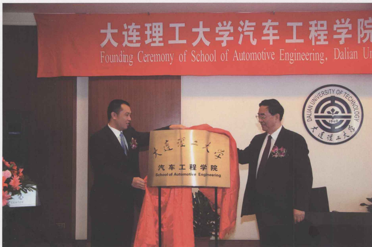
5月19日，大连理工大学汽车工程学院成立暨软件捐赠仪式隆重举行，这也是辽宁省高校举办的首个汽车工程学院。