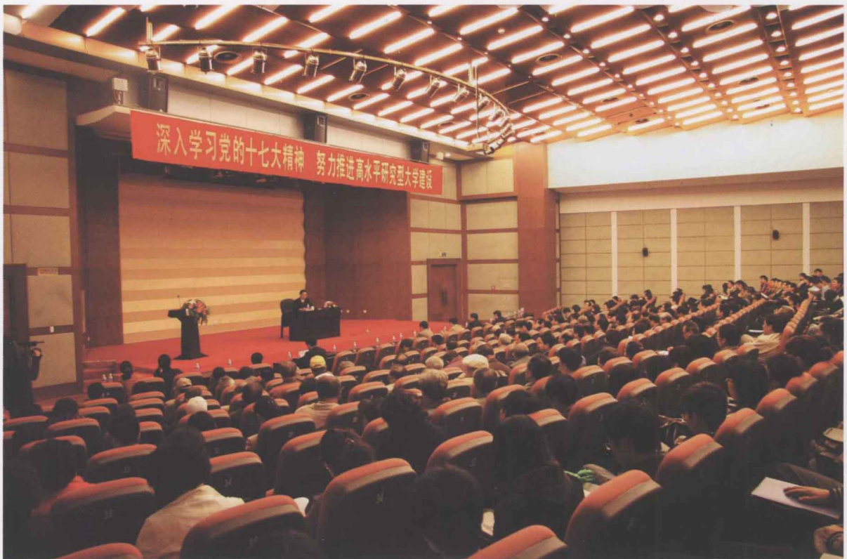
10月24日下午，校党委以“深入学习党的十七大精神，努力推进高水平研究型大学建设”为主题，召开党委学习中心组（扩大）学习会议，传达十七大精神，对全校学习宣传贯彻十七大精神作出部署。