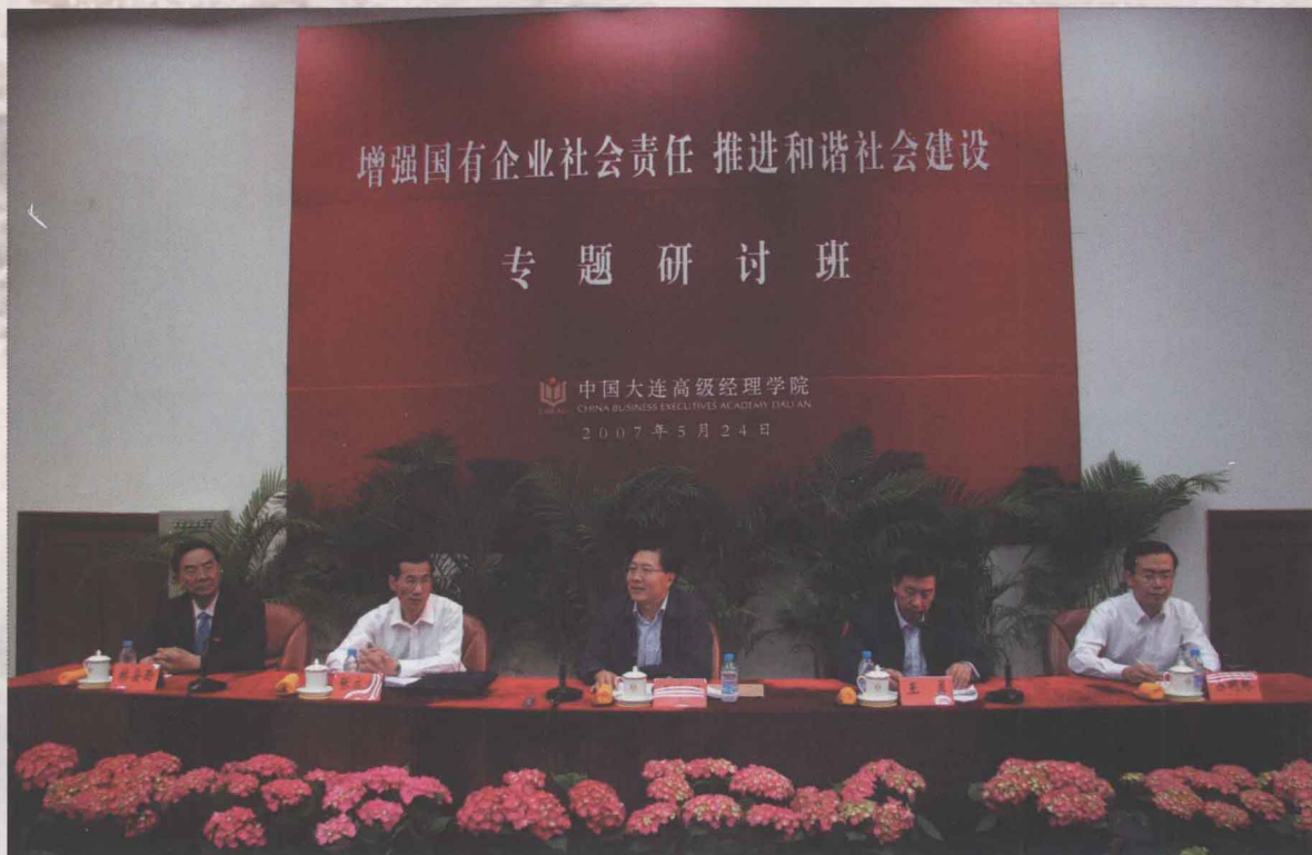
5月24日至26日，中国大连高级经理学院举办2007年首期专题研讨班，65家中央企业负责人参加学习研讨，中组部副部长王东明同志在结业式上讲话。