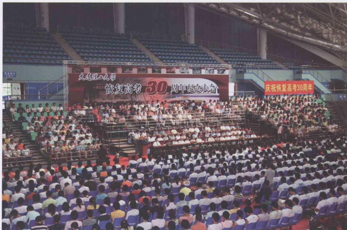
8月19日，学校在刘长春体育馆召开恢复高考三十周年纪念大会，700多位77级校友返回母校，见证发展，畅叙别情。