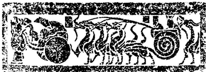
图1 马车和龙拉的车（山东省费县潘家潼）

这一点，图1很有趣。从样式来看，应当是2世纪左右的東西。在画像的左边，停着卸下了马的马车，马夫靠着车辕，把扇子举在头上，正往上看，似乎在等待着什么。马车上的男子低着头，一副有气无力的样子。马车的后面有龙拉的车，车轮呈漩涡状。这是可以在空中驰骋的所谓“云车”。看情形应该是，左边的乘车的男子，坐着马车，终于来到了最后的目的地，然而一直没有谁来迎接他升天，正疲惫不堪地等待着。不知道从何而来的迎接的车驾，已经停到了身后。当时，有句话被认为表达了所有人的愿望，经常刻铸在日常使用的青铜镜上，其中讲道：“上泰山，见仙人，食玉英，饮澧泉，驾蛟龙，乘浮云。”（见西汉《泰山镜铭》）可以想象，这幅画像石描绘的正是这一愿望终于成为现实的景象。不管怎样，当时的人们非常清楚，必须有怎样的交通工具才能够升到天上。