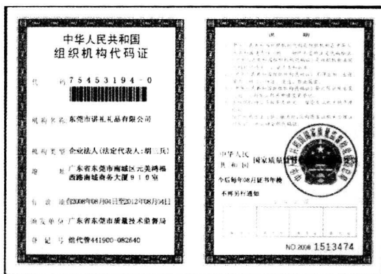
图 1.2 组织机构代码证