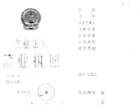
图 1.1 企业法人营业执照