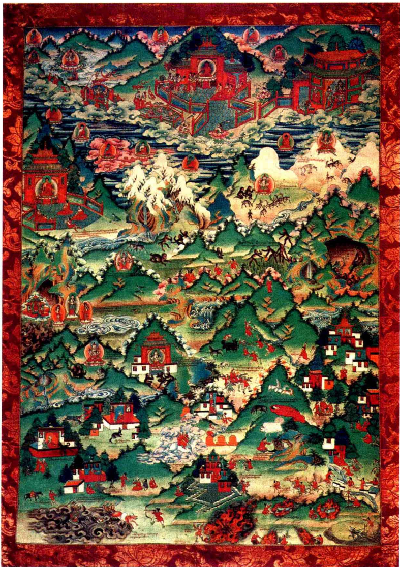
图 1-1 唐卡“猕猴变人”过程，布达拉宫唐卡画

萨联系起来，发展出很多神话故事。虽然现代研究人员无法把神话传说里的故事当作历史的事实，但我们仔细地进行研究和推敲，还是能够从中找到具有科学价值的依据，如“猕猴变人”（图 1-1），“猴子和岩魔结合”等说法都有一定的道理。