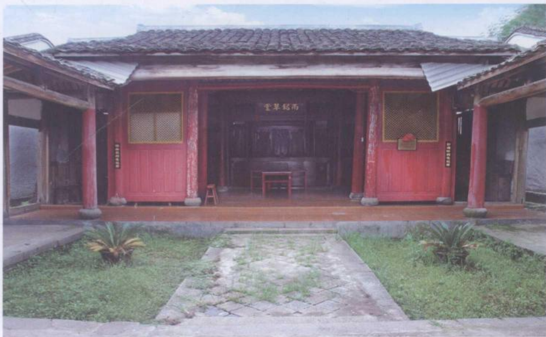
东方军御簾司令部遗址（张氏大祖屋）