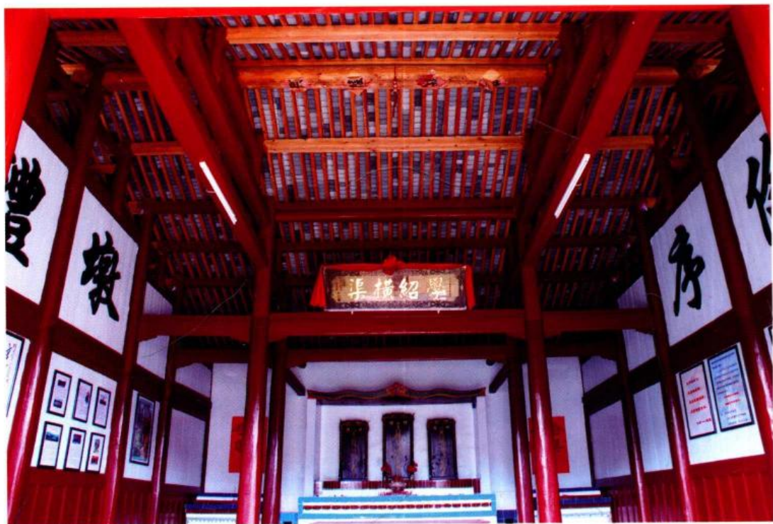
红军战地医院遗址