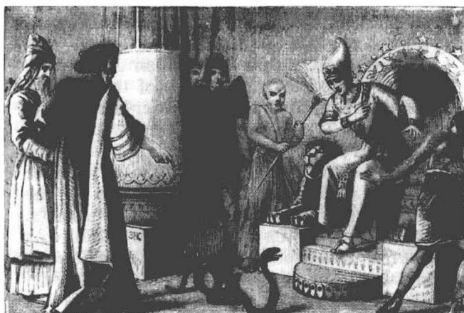
图 0-3 在法老面前的摩西和亚伦

祭司，并供职一生。他去世之后，这个宗教就被称为奥西里斯教——之后被透特（Thoth）传播到埃及，就演化成了埃及的宗教。”