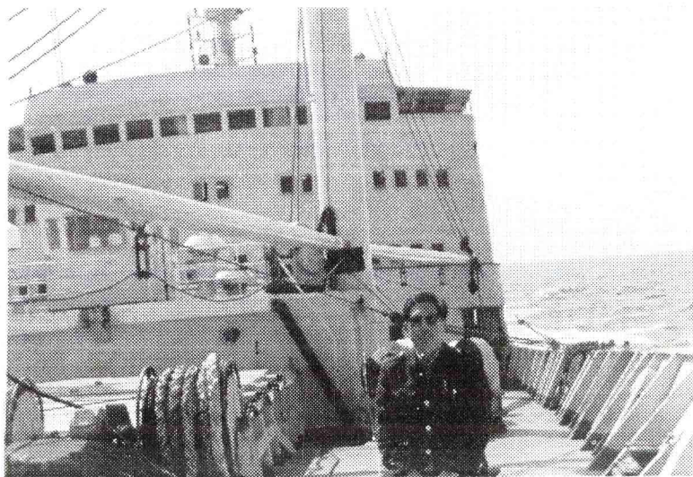
在青岛至上海客轮上