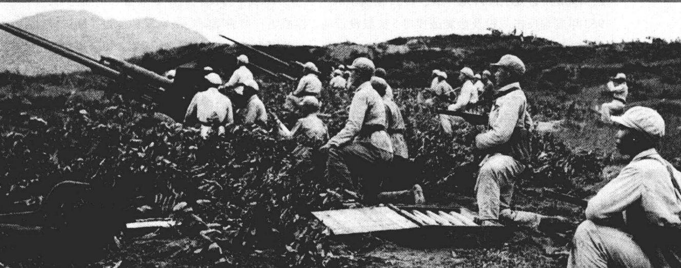
志愿军炮兵严阵以待。

文登里反坦克作战，创造了我军战史上的几个记录：一是首次组织规模最大的反坦克战斗，二是首次构筑专门的反坦克阵地，三是首次建立专门的反坦克战斗编组，四是一次战斗中遭遇敌军坦克的数量最多。日后，八一电影制片厂以文登里反坦克作战为蓝本，拍摄了电影军教片《坚守文登川》。