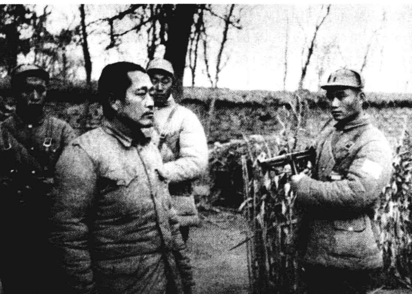
淮海战役中被我军俘虏的国民党军徐州“剿总”副司令杜聿明。

渡江战役，强渡之前，敢于炮击耀武扬威向我军挑衅的英国远东舰队，并给予英舰重创。在这次有名的“紫石英号事件”中，打得英国人举起白旗，大长了中国人的志气。强渡之时，参加东突击集团，作为第10兵团渡江第一梯队，在王坝港两侧登陆成功。第69师第207团第5连第1排荣获“渡江英雄排”光荣称号。接着，切断了沪宁铁路，逼近到武进地区。占金坛，