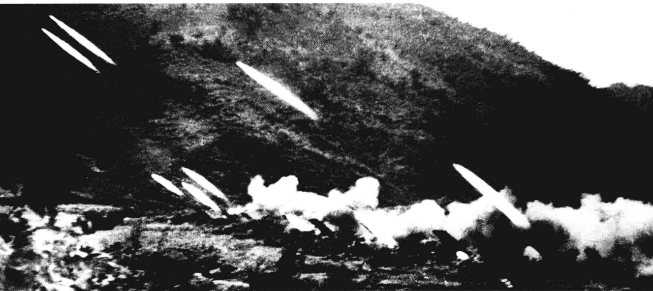
金城战役中，志愿军火箭炮向敌阵地齐射。

☆第60军6个团、第68军1个团北汉江左岸进攻战斗，占领阵地30平方公里，打退敌反扑多次，歼韩5师、韩3师等9,000余人。其中，反击883.7等3个高地的战斗，一举创造志愿军阵地战期间一次攻歼韩军1个团的模范战例，受到中朝联合司令部的通报嘉奖。