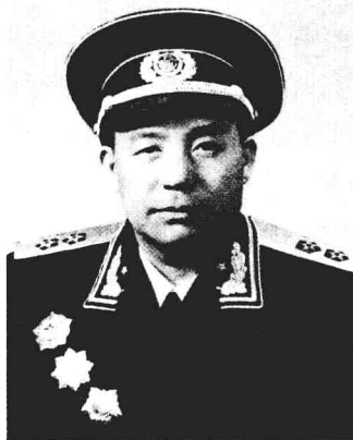
曾任第42军军长的吴瑞林中将。

在大西南战役的鄂西之战中，第42军主力作为右集团部队，参加了战斗。彭龙飞、谭文邦的第125师从秭归渡江向建始、恩施前进；翟毅东、丁国钰的第124师由洛阳车运南下，沿江北的兴山至巴东一线，监视川东孙震所部。11月3日，廖仲符的第155师与兄弟部队一起，突破漆树垭、野三关敌第124军防线直指恩施鸦雀水。同日午后，第124师的9名勇士驾渔船，强渡长江三峡一举成功，尔后，第124师乘胜解放了有“楚西厄塞”之称的巴东县城。