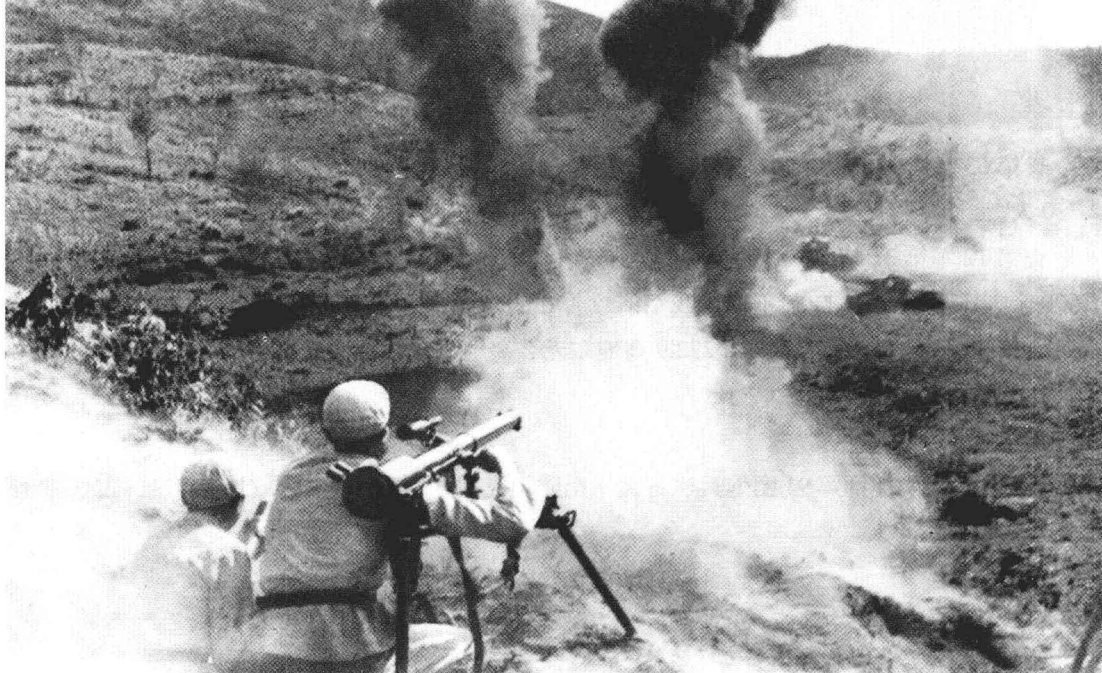
1951年夏秋防御作战中，志愿军某部战士在文登里打击美军坦克。

☆第47军第139师第415团朔宁东南地区防御战斗，依托野战阵地，10天歼美骑1师、希腊营计4,000余人。第47军一上阵就出手不凡，不愧为我军最善守的钢铁盾牌。