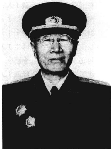
在党的七大上当选为候补中央委员的万毅中将。

177位开国中将都先后被授予勋章，但是能够荣获3枚一级勋章的将军，在中将里也不算多，经过统计共有59人获此殊荣，正好是中将总数的1/3，比例为33.4%。开国中将被授予勋章的具体情况如下：