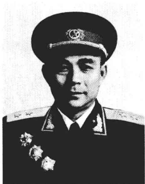
曾任第20军军长的刘飞中将。