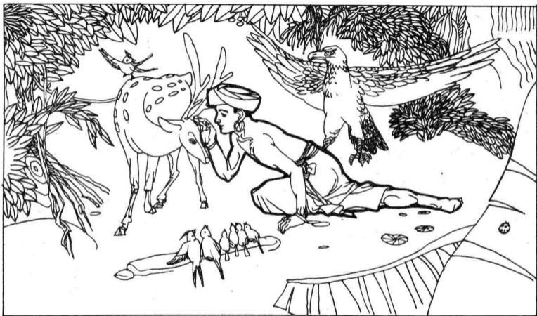
11. 阿达尼罗由于久居山林，他熟悉鸟语兽叫的声音，还常常同它们在一起愉快地交谈。