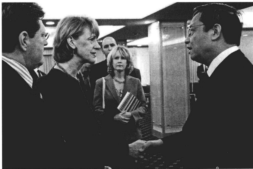
2008年5月20日，会见前来驻美国使馆哀悼汶川地震罹难者并捐款的美国工商界人士。

5月13日，胡锦涛主席应约同布什总统通电话。布什表示美国愿向中方提供一切可能的帮助。当天，我会见美国总统国家安全事务副助理杰弗里时，向美方通报了汶川地震灾情和我国抗震救灾工作。美国助理国务卿希尔打电话给我表示慰问，表示如中方有需要，美方愿向中方提供更多援助。美方已经做好准备，将随时应中方要求派搜救队赴华。美国国会众院“美中工作小组”共同主席拉森和柯克分别打电话给我表示慰问。美国国会众院在全会期间举行静默仪式，向汶川地震灾难中的死难者表示哀悼。我接受美国公共广播公司（PBS）“吉姆莱尔新闻一小时”栏目国际新闻首席记者玛格丽特·华纳专访时，重点介绍了国内地震灾情以及中国政府和领导人领导全国人民抗震救灾情况。驻美使馆发布《中国全力开展抗震救