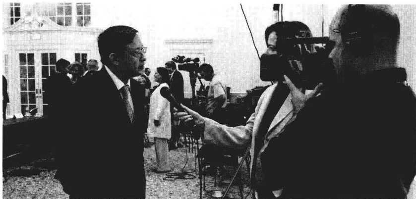
2008年6月6日，出席“美国对中国地震做出反应”圆桌会议期间接受美国记者采访。