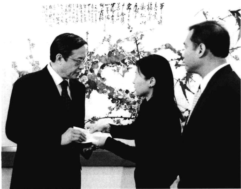
2008年5月20日，接受华人华侨、中国留学生等抗震救灾捐款。

在地震后相当一段时间里，中国政府救灾的效率，灾情和救灾报道，在世界和美国面前树立了良好形象，也让世界看到中国人民的坚强伟大。我感受到旅美华侨、留学生们血浓于水的同胞情义；为美国各界对中国地震灾区的人道主义支援所感动。这些情景令我联想到两年零九个月之前中国支援美国“卡特里娜”飓风灾难的日日夜夜，感受到“救灾外交”的互动。