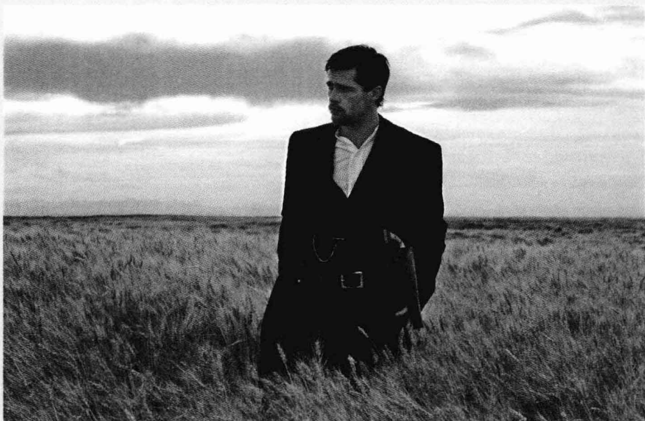
《神枪手之死》( The Assassination of Jesse James by the Coward Robert Ford , 2007)