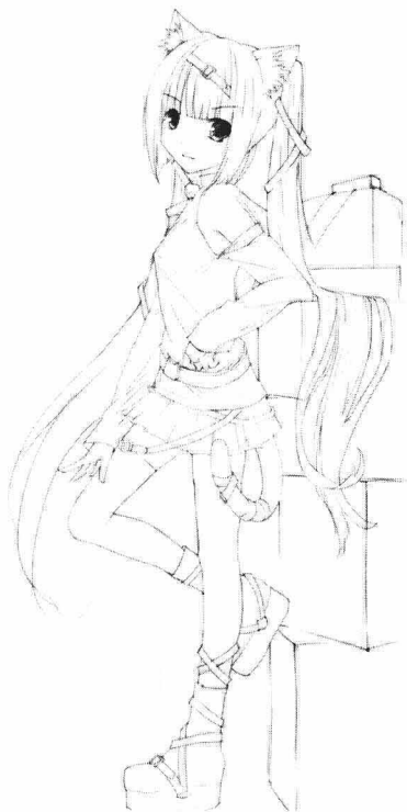
可爱的小狐狸，有点胆小、害羞，却很温柔善良。