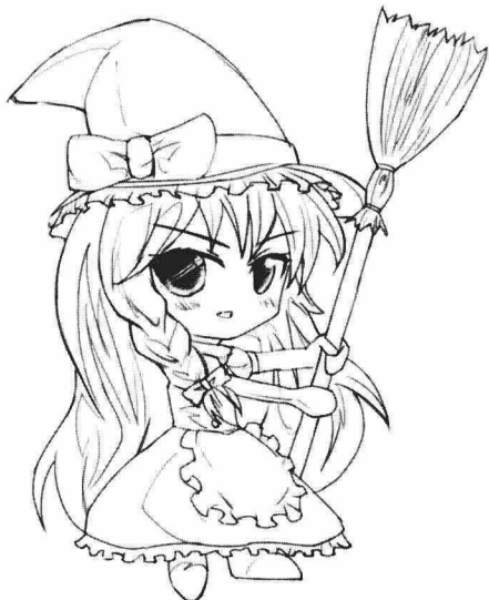
活泼、调皮、爱恶作剧、可爱、有点阴险，拿着扫把的小巫女。

特质的装饰能加强人物效果，增进人物的真实性，突出人物的性格，往往起到画龙点睛的作用。这些装饰不单单是为了体现其本身的价值，更重要的是它婉转地表达了一些含义，或是带有某种魔法，或是含有特殊寓意，使得这种诉说变得委婉动听。