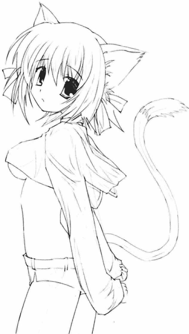
猫耳朵、猫尾巴，穿着有猫特质的服饰的女孩给人一种可爱、黏人但又有点野性的感觉。以黑色调为主，显示出独立的特性，给人以神秘的印象。粉红色的条纹和带有猫耳朵的帽子显示出人物有点活泼，有一颗童真的心，喜欢孤单，却又害怕寂寞。精致的服饰，精干的短发，搭配粉红色的发带，塑造出一个单纯、灵活、可爱的小猫形象。