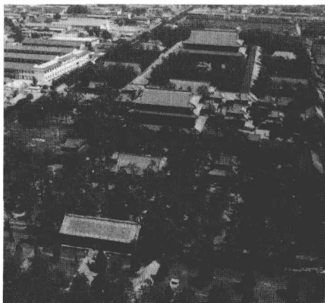
曲阜孔子庙鸟瞰图

汉高祖十二年（公元前195）十月，刘邦在击败黥布返回长安的途中，戎马倥偬，专程到曲阜阙里孔子庙以太牢祭祀孔子，首开帝王亲自祭祀孔子的先河，后世儒家为推崇孔子，表彰汉高祖，大肆宣扬“汉家四百年基业全在于此”。汉武帝罢黜百家、独尊儒术后，孔子思想成为国家的指导思想，为显示国家对孔子的尊崇，根据中国崇德报功的传统，将孔子奉祀在国立学校内。东晋时，为满足祭祀的需要，国家在最高学府国学内专门建造奉祀孔子的庙宇。北齐时，“郡学则于坊内立孔颜庙一所”，将孔子庙推广到地方。唐贞观四年（630年），唐太宗下令州县学校皆建孔子庙，从此孔子庙遍及中国各地。唐以后，历