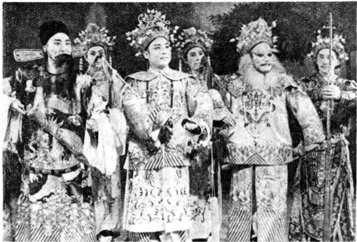
1 清康熙年间，皇帝南巡浙江。一日，康熙去南山打猎，亲王达麻苏、大臣彭朋及御林军等随行保驾。