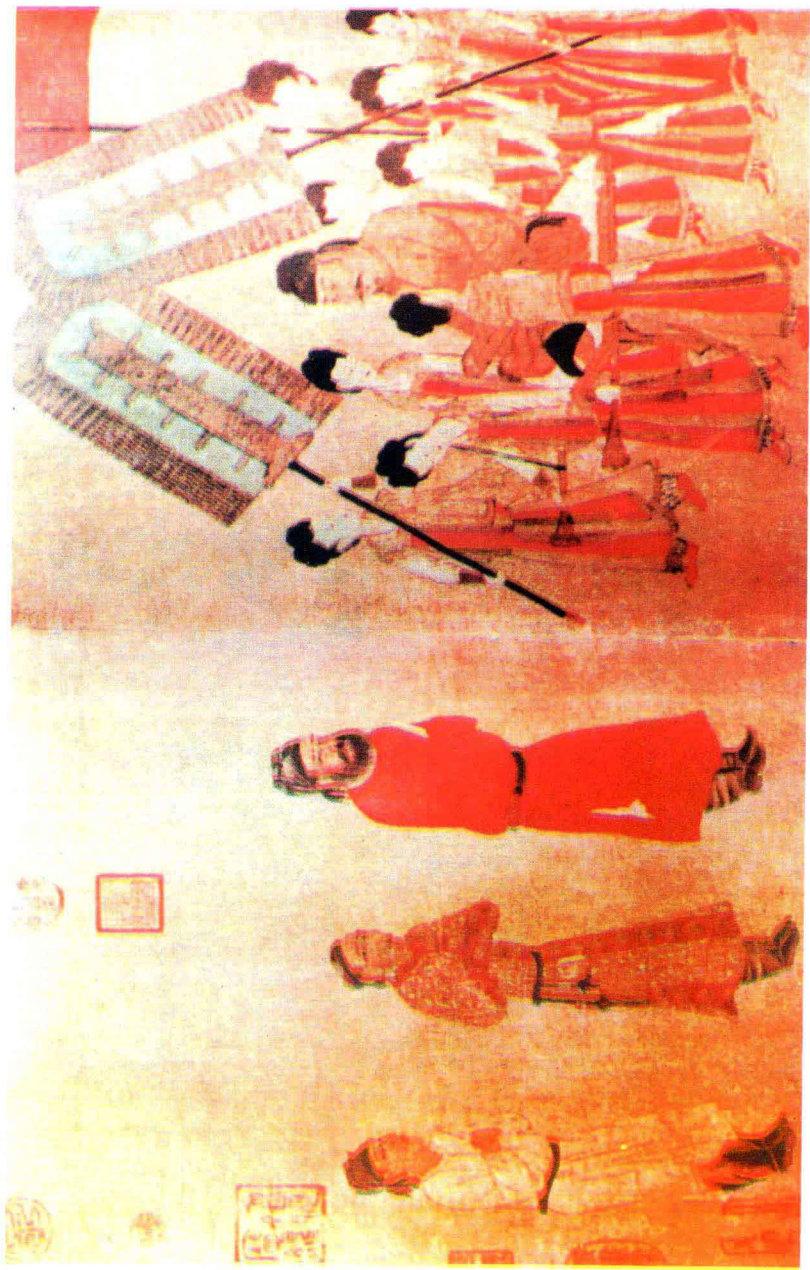
阎立本所绘唐太宗迎吐蕃使者图像（现存台北故宫博物馆）