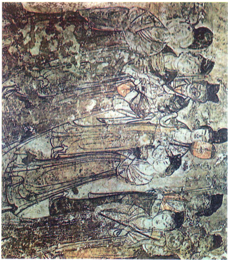
唐永泰公主墓内壁画上所示唐家庭中妇女装束