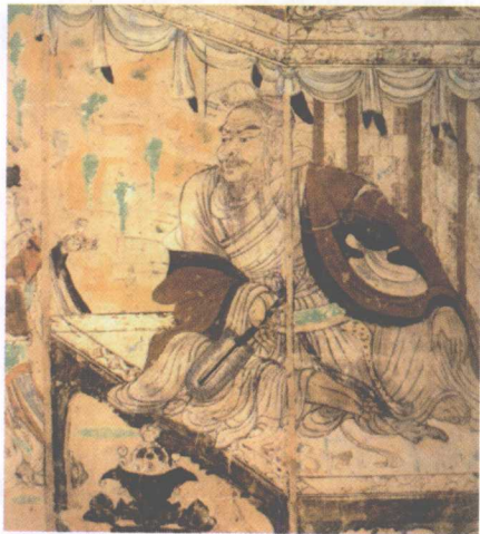
吴道子的《维摩诘像》

吴道子的出现，是中国美术史上的光辉一页。一代文豪苏东坡曾说过：“诗至杜子美，文至韩退之，书至颜鲁公，画至吴道子，而古今之变，天下之事毕矣。”在历代从事绘画与雕塑的工匠行会中均奉吴道子为祖师，尊他为“百代画圣”。由此可见，吴道子在中国绘画史上的至尊地位。