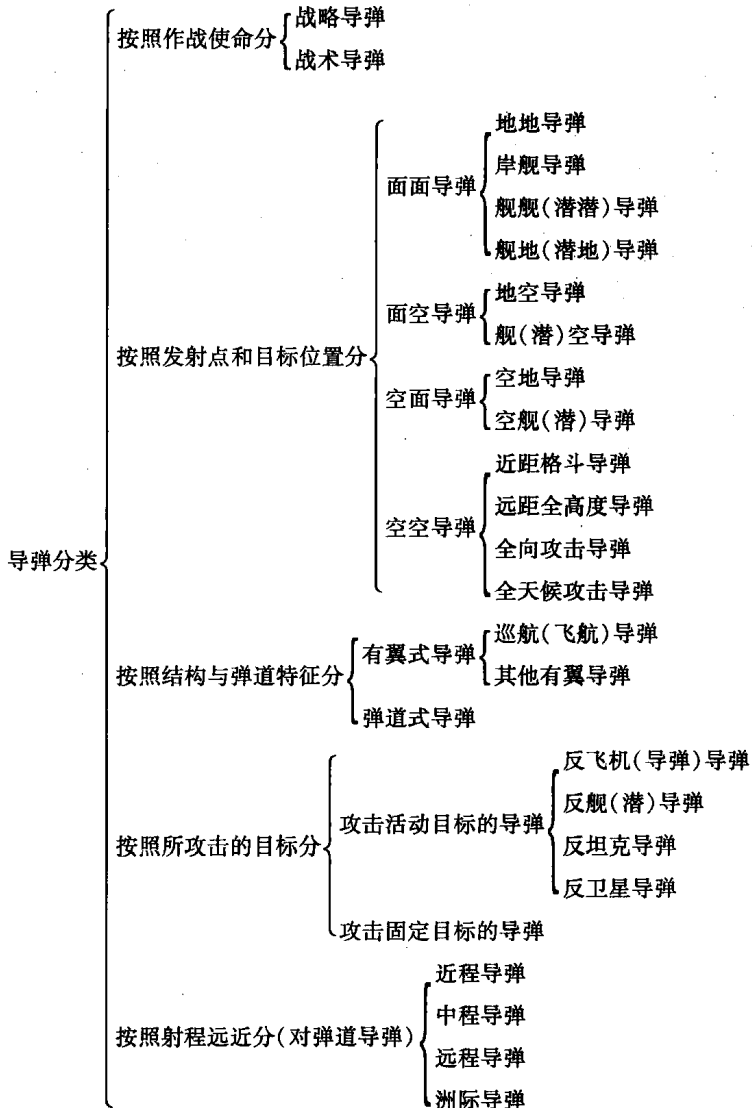
图 1-3 导弹分类

目前,世界上导弹的种类达几百种之多,而且新研制的导弹不断地出现,为了分析研究和使用的方便,需要把导弹进行分类。分类方法很多,称谓也不尽相同,但一般是根据导弹的不同特征分类。导弹常用的分类如图 1-3 所示。