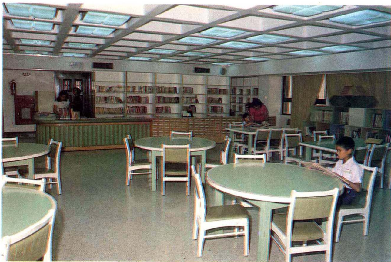
台北行天宮兒童圖書館