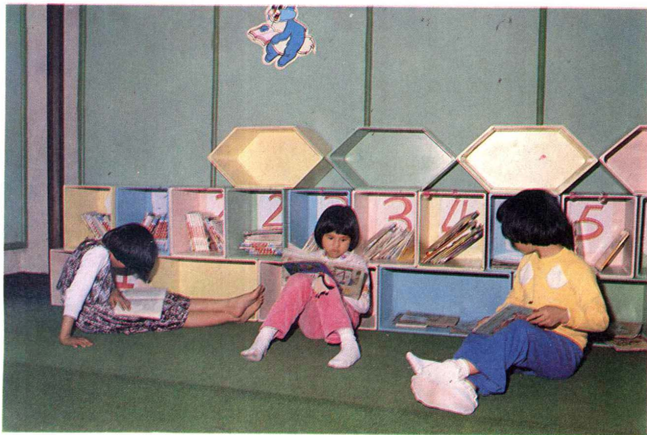
高雄市中正文化中心兒童室