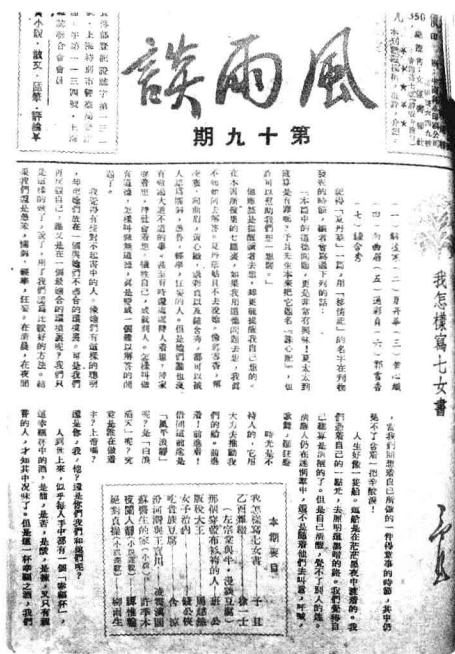
《风雨谈》第十九期封面