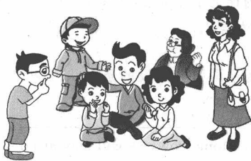
He is sitting among many people. 他正坐在许多人中间。