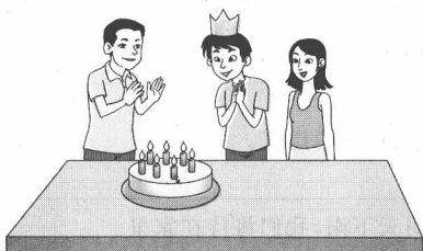
I am standing between Father and Mother. 我正站在爸爸和妈妈中间。

我们可以说 between you and me,但不能说 between you and I,因为 between 是介词。