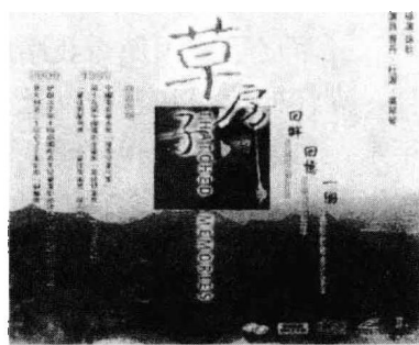
《草房子》 1999年 中国电影华表奖（优秀儿童电影奖）

然而不独桑桑，这小说里所有的人物都带有某种精灵气息，像秃鹤似乎超出儿童常态的强烈内心冲突和报复心理，像杜小康的绝顶聪明及其鹤立鸡群式的高贵气度，像白雀飘飘欲仙的美貌和忧郁，像纸月神秘的身世与超凡出世般的书卷气，像秦大奶奶不无滑稽的固执及其后来感动地的善举，即使是外来的男孩细马，其异常的