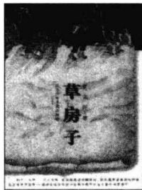
《草房子》 1997年 江苏少年儿童出版社

长篇小说《草房子》，其作者曹文轩在这方面显然有自己明确的追求目标，他在这部小说的“代跋”中提出一个问题：“怎样让今天的孩子们感动？”是的，今天的孩子们，特别是都市里的大部分孩子们，物质生活条件太好了，所欲所求几乎应有尽有，还有什么能使他们感到稀罕和感动的呢？但是优秀的文学作品就应该具有这样的神奇力量，文学的使命就在于此，将沉醉在物质的丰裕中的懵懂儿童向精神的丰裕提升。