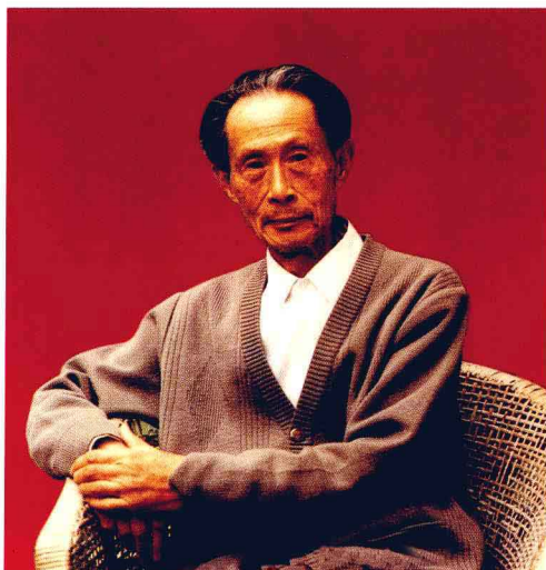
贵阳籍著名书画家谢孝思、刘叔华（下图）