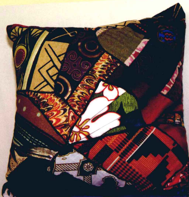
古怪的靠垫 弗朗西斯·特纳 (Frances Turner) 来自南非的手工缝制土色布 25cm × 25cm × 13cm