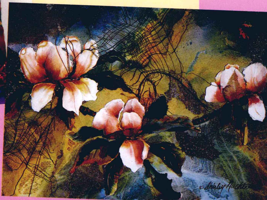
木兰花 雪莉·艾丽·纳奇特里布 (Shirley Eley Nachtrieb) 水彩拼贴 28cm × 38cm