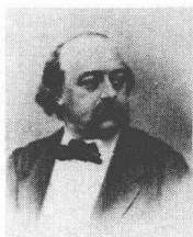
画像上的福楼拜（Gustave Flaubert, 1821—1880）踌躇满志，蔑视名利。“文学界不管发生什么，都与我无涉。我将一如既往，只为自己写作，只为自己一人写作。”他甚至宣称，“我要写惊世骇俗的东西，比如男妓、蛇妻等。”（1858年6月24日致欧内斯特·费多函）

我个人不太喜欢福楼拜的两部历史小说——《萨朗波》和《圣安东的诱惑》，相反，对《情感教育》似乎有一种偏爱。1970年普法战争的爆发使得福楼拜的这部“法国语言最美的小说”（古尔蒙《风格问题》）饱受贬斥和忽略。但是在福楼拜溘然长逝之后，人们才清醒地看到，《情感教育》的失败之处仅仅是白璧微瑕，就整部作品而言，则是无比辉煌的，萦绕着刻骨铭心的青春回忆，正如邦维尔所言，这是一本