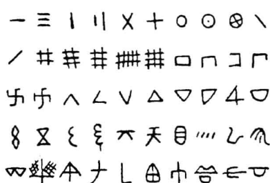
青海乐都柳湾陶器符号

汉字的初创时期，是指汉字从无到有，从符号与图画演变成文字为文字的时期。据古代传说记载，汉字产生于黄帝时代，即距今5000年至4500年前后这一时期内，但据考古资料来看，汉字的产生要远远早于这个时期。前文已述，陶符是汉字的来源之一，目前发现最早的陶符是河南省舞阳县贾湖陶符，距今已有8000年历史。稍晚的是大地湾陶符，距今已有7350至7800余年，这些陶符出土于甘肃秦安大地湾新石器遗址，绘制在钵形陶器内壁上，共有十余种，形状与半坡陶符相似 ① ，它是仰韶文化陶符的源头。而仰韶文化的陶符距今也有6000余年，这一时期的陶符除了西安半坡之外，在黄河流域的其他地方与长江流域也发现许多。其后还有甘肃、青海等地发现的马家窑文化（如青海乐都柳湾陶符），山东发现的龙山文化，浙江、江苏等地发现的良渚文化均有陶符出土。近年来在安徽蚌埠双墩新石器文化遗址中，发现了630多个陶符。专家们认为，它们是汉字的源头之一。这一情况说明，陶符作为一种创制中的文字，正在发展之中。在山东省莒县陵阳河遗址出土距今约有4500年的一些陶器刻划符号，已被认为是汉字了。它们是：