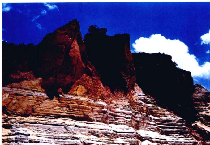
● La forêt de sable coloré au Yunnan.

dans l'océan Indien, en passant par la gorge du Yarlungzangbo, la plus grande gorge du monde avec 504,6 km de long et 6 009 m dans sa profondeur. L'Ertix dans le Xinjiang coule vers le nord et se jette dans l'Océan arctique glacial après avoir traversé la frontière de Chine. Quant aux cours d'eau qui se jettent dans les lacs endoréiques ou disparaissent dans des déserts ou des marais salants, ils ont une aire de drainage occupant environ 36% de la superficie du territoire de tout le pays. Le Tarim, long de 2 179 km et coulant dans le sud du Xinjiang, est le cours d'eau endoréique le plus long en Chine.