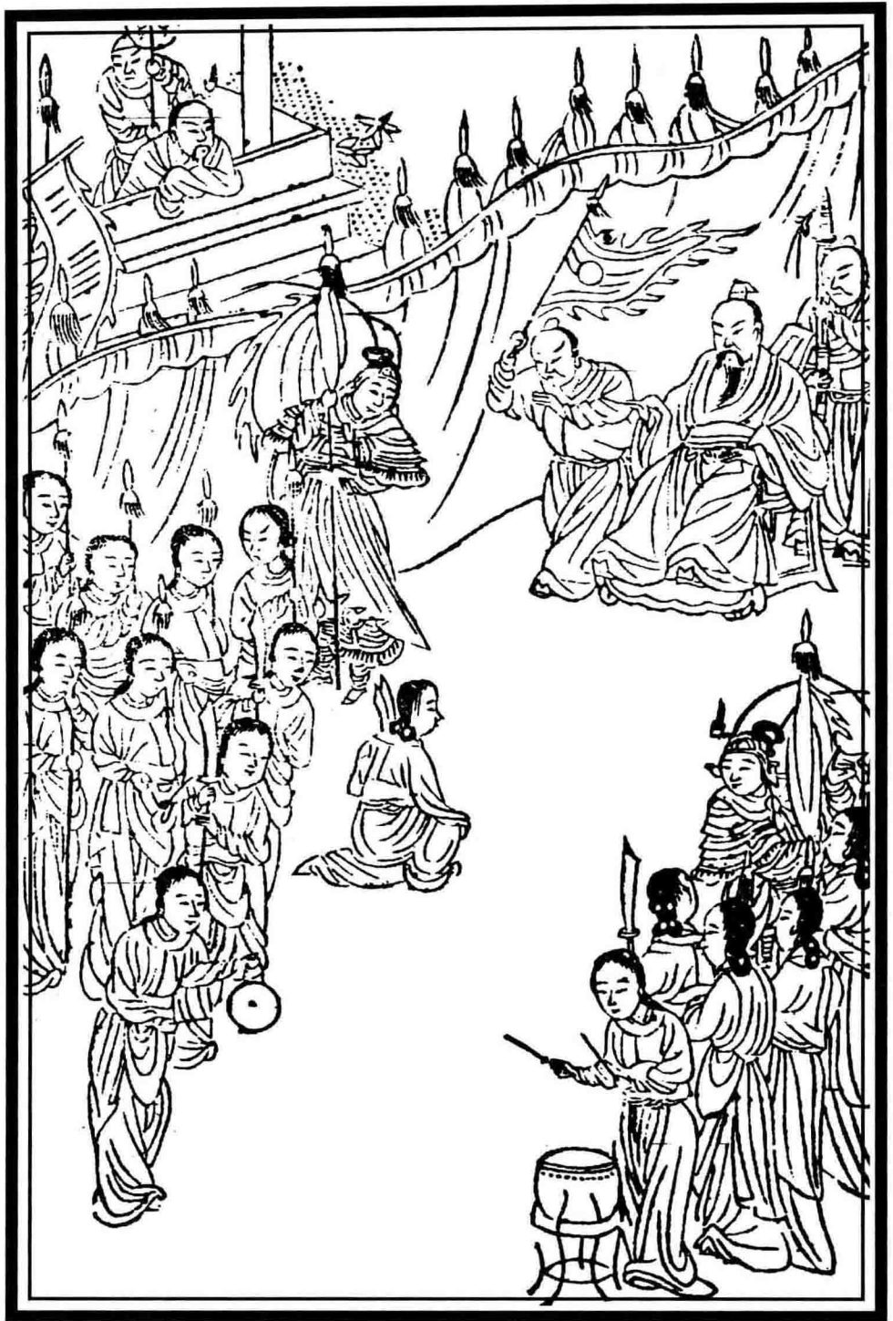
孙武吴宫教战图 清·佚名