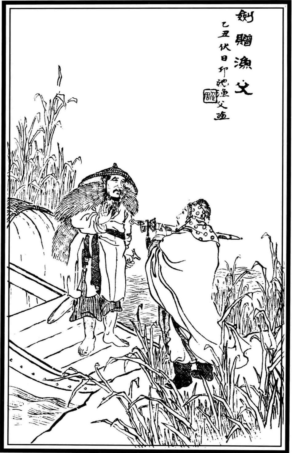
劍贈漁父圖 清·馬 駘