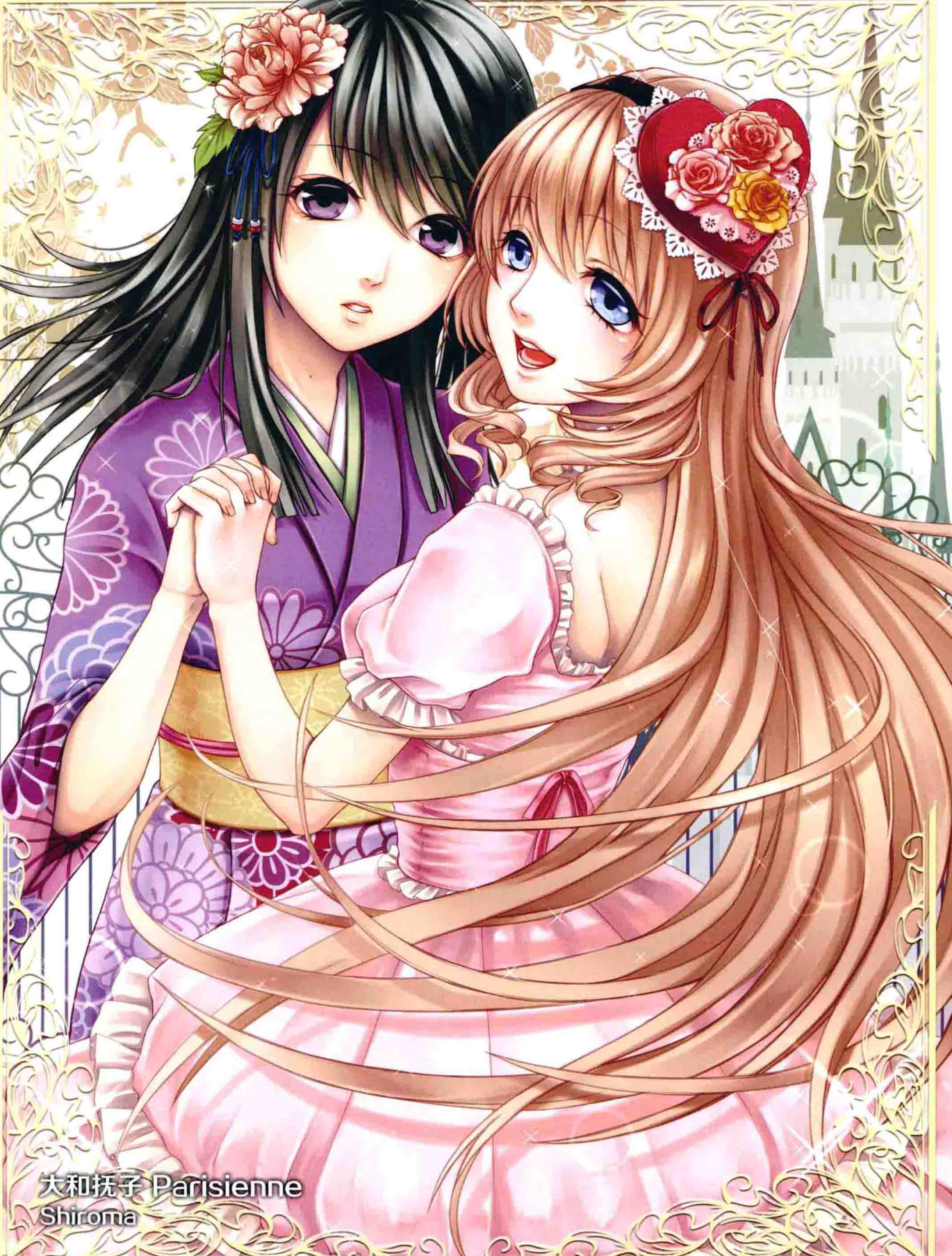
大和抚子 Parisienne Shiroma