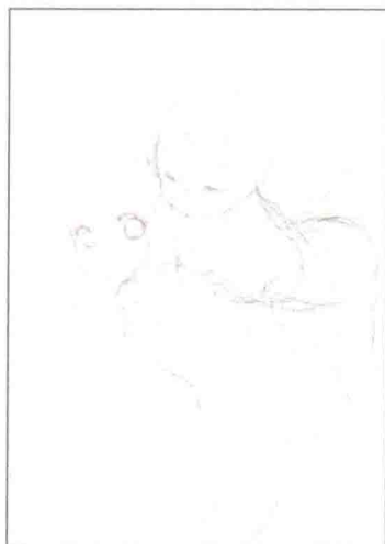
底稿: 进一步画出底稿的细节。