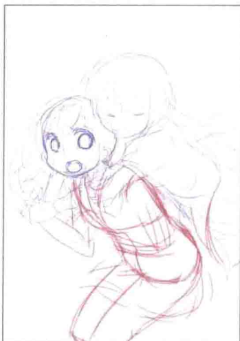
草图 2: 确定好身体的朝向、牵手的、手臂位置、人物的表情等。