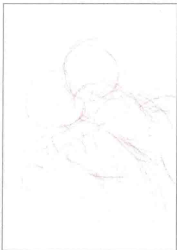
草图 1: 首先要确定大致的构图。这次要画出后抱型。

亲密接触的部分要作为重点仔细绘制，然后再画出其他部分。由于距离感非常重要，因此要将两人作为一个整体的模块来进行考虑。