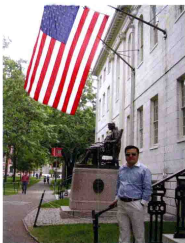
作者在哈佛大学哈佛铜像前留影