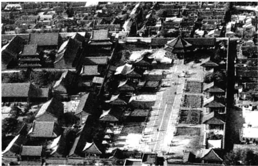
图 1-1 盛京城全景

这本教材的观点是：在承认文化的整体性的同时，更要承认文化的差异性和多样性；看到其层次性，也要看到其发展性。盛京城全景如图 1-1 所示。