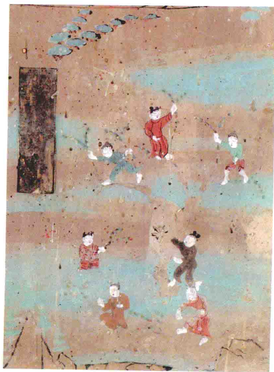
群童采花 莫高窟第 112 窟 西龕西壁 中唐