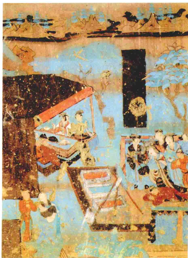
晚唐婚嫁图 莫高窟第 12 窟 南壁 晚唐