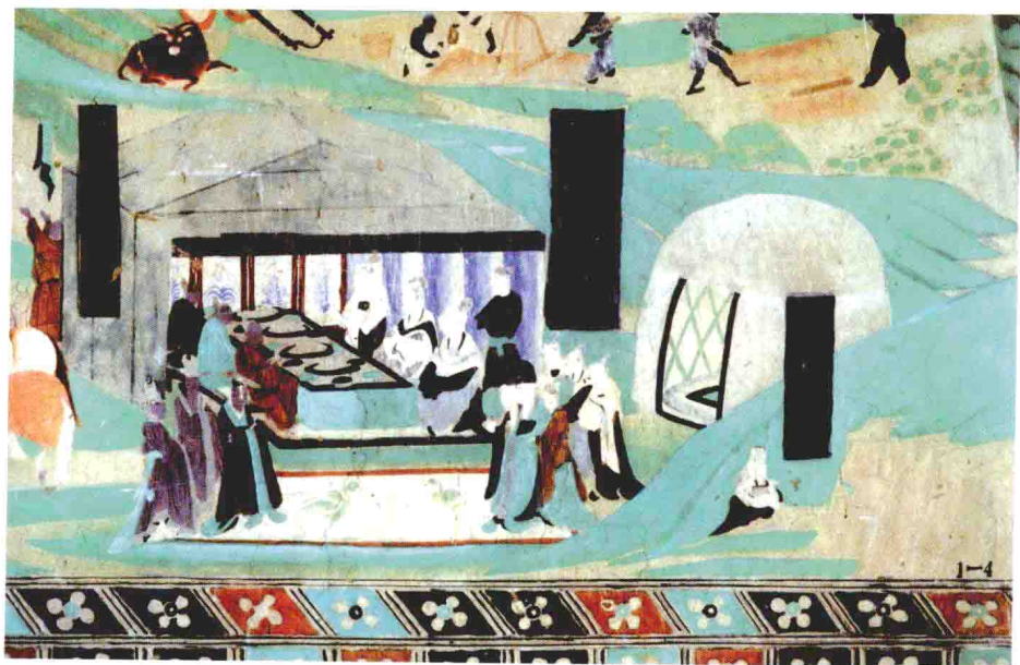
男女相对互礼图 莫高窟第 148 窟 南壁 盛唐