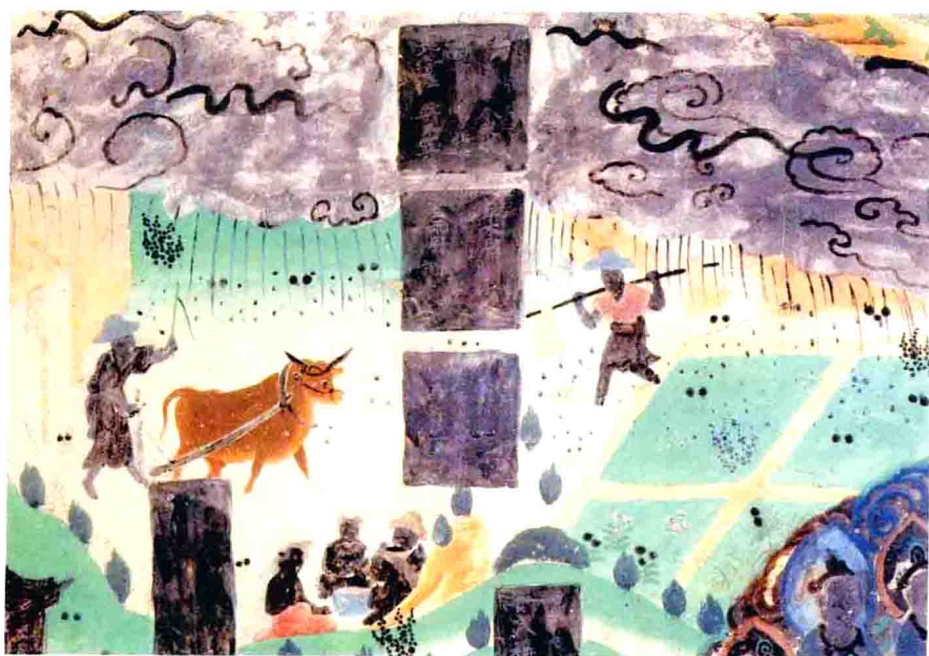
雨中耕作图 莫高窟第 23 窟 北壁 盛唐