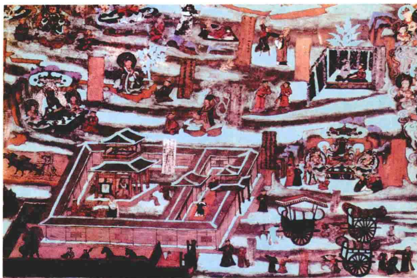
富家宅院图 莫高窟第 85 窟 南顶 晚唐