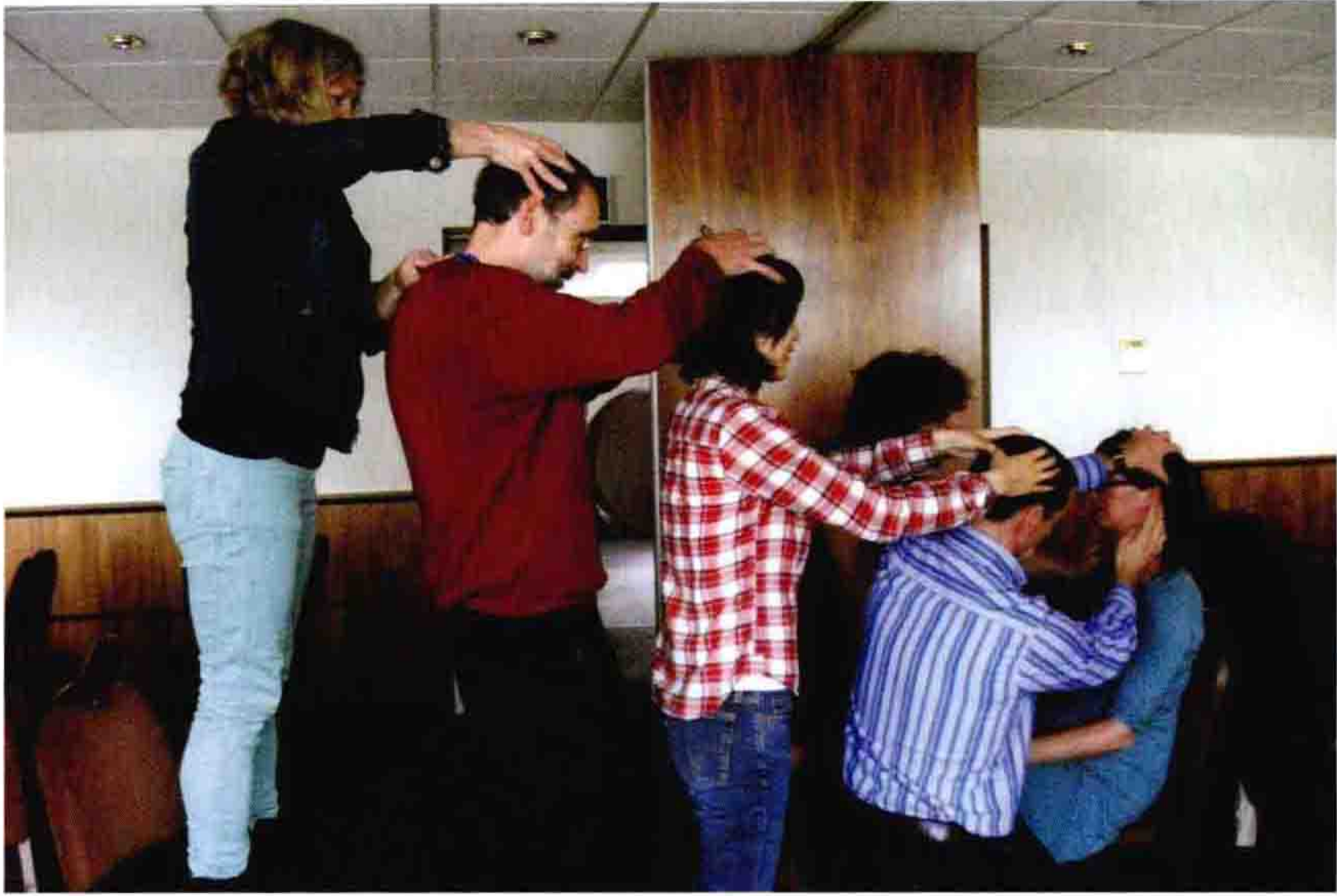
◎ 学生们互相摸后顶穴