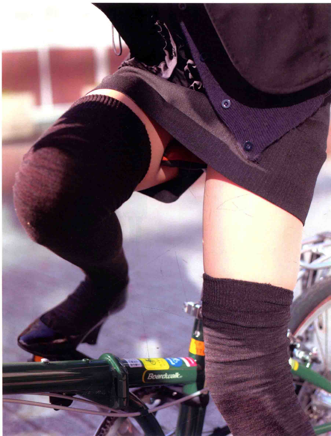
25歲 新聞業 右/3:0.5:3.5 左/3:2:2 人造羊毛·聚酯纖維·羊毛·聚氨酯