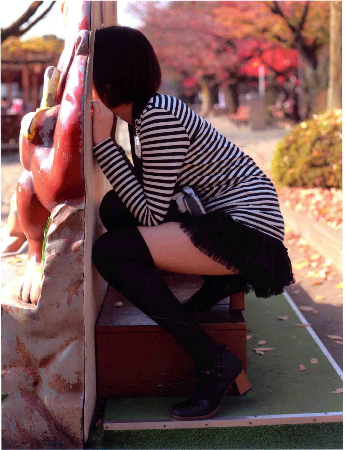
23歳 販売員 右ノ? 左ノ 2.5:2.5:2 聚酯纖維、聚氨酯