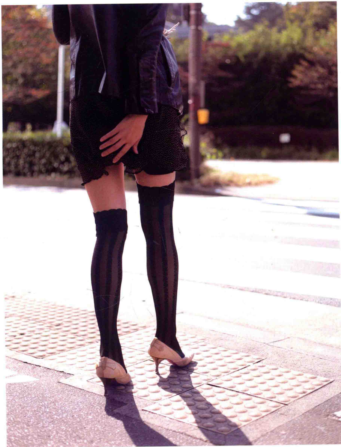
26歲 外賣業 右/4:1:2.5 左/4:2:1.5 尼龍、聚酯纖維、聚氨酯