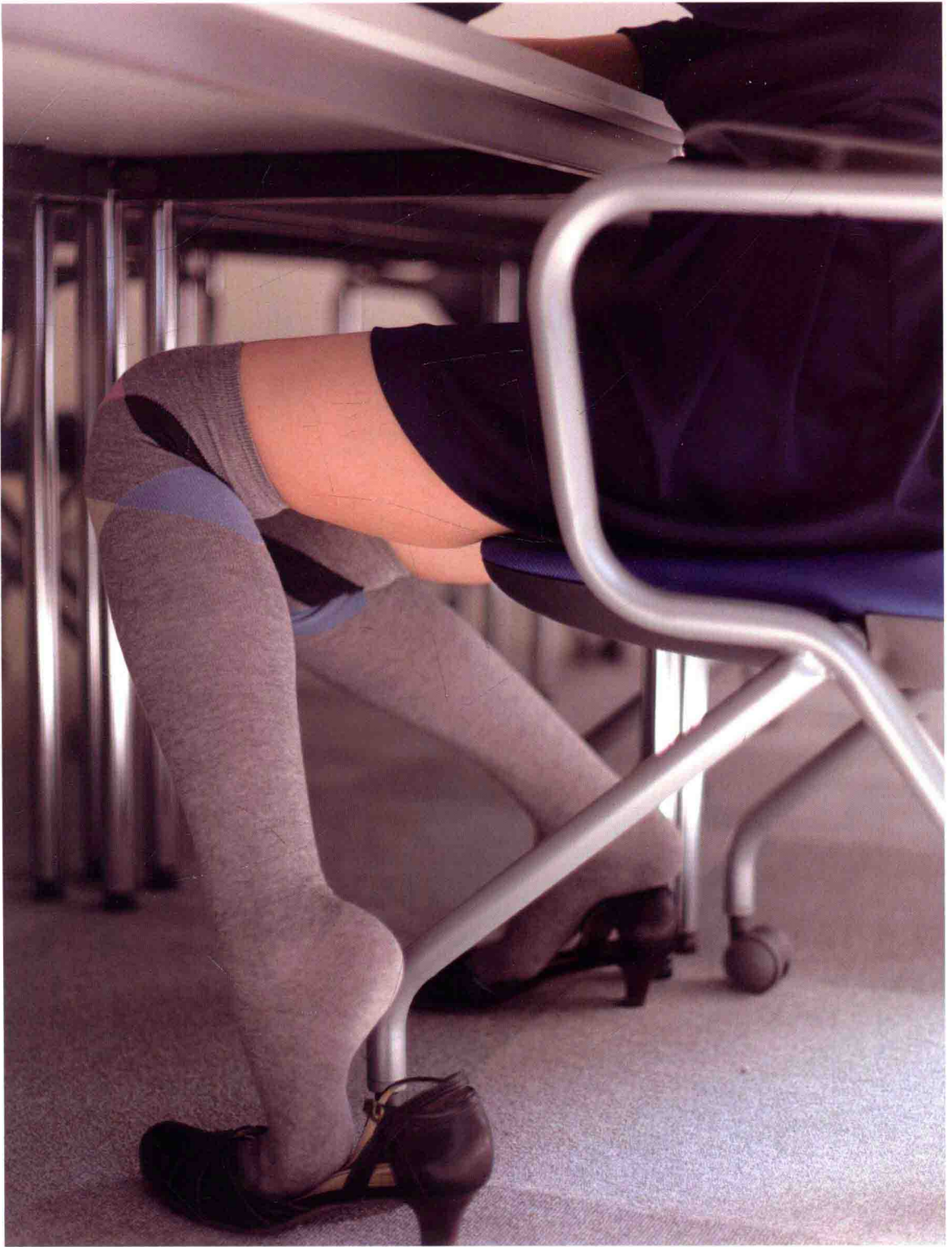
24歲 宣傳 2.5:3:1.5 綿、聚酯纖維、其他