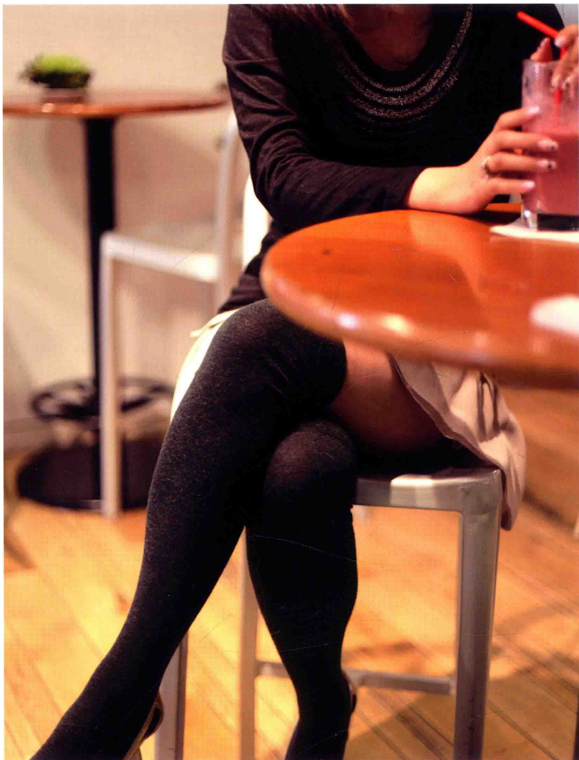
26歲 製造業 右/? 左/ 3.5:1.5:2.5 綿、人造羊毛、尼龍、聚氨酯、人造纖維