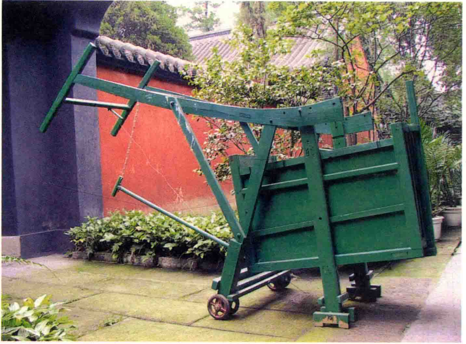
成都向國富所製作的向氏木牛模型