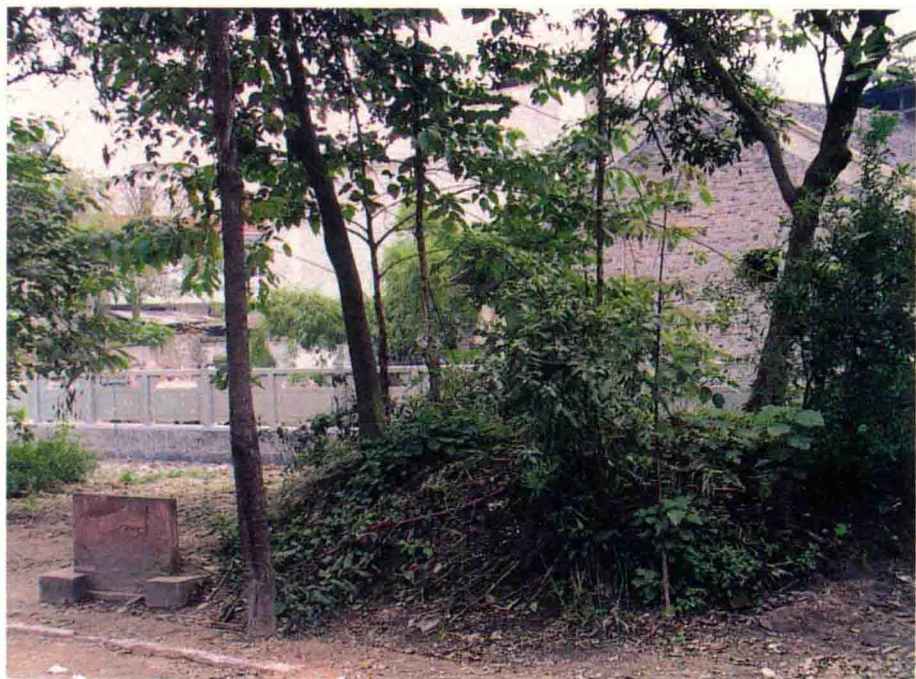
成都新都彌牟鎮八陣圖土堆