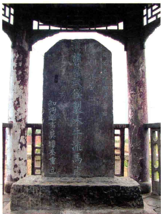
諸葛亮製木牛流馬處碑