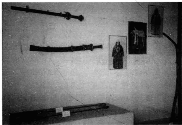
沈阳故宫陈列的旗兵弓箭与刀剑