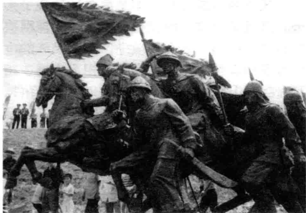
沈阳市郊锡伯族西迁兵勇塑像

在女真三大部中，满洲的形成与建州女真的关系最为直接。到16世纪末，建州女真实际上分为建州五部（浑河、完颜、苏克苏护河、董鄂、哲陈）和长白山三部（鸭绿江、讷殷、珠舍里）。努尔哈赤自明万历十一年（1583）起兵，至万历十六年（1588）统一建州五部共用了五年时间。接着又用了大约五年时间，在明万历二十一年（1593），把长白山之讷殷部、珠舍里部、鸭绿江部也收归旗下。女真人的统一，意味着他们由分散的状态凝聚成一个紧密联系的整体。过去争王称长、相互残杀所产生的矛盾和仇恨由于统一而逐渐被淡忘，思想文化随着交往的频繁而逐渐趋于一致，民族心理和民族意识