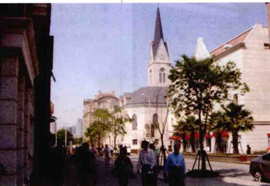
■ 高桥新城街头游人络绎不绝

游完古镇，还可以到高桥新城“荷兰城”走一走。高桥港河将老街和荷兰新镇这两部分连在一起。荷兰新镇以著名的荷兰卡腾布鲁克小镇为设计原型，大风车是荷兰新镇的标志物。可先沿着河道向着风车的方向行走，河道整治得非常干净，绿树葱茏。过一小铁桥