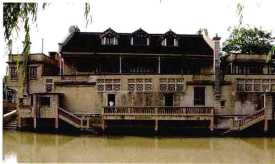
■仰贤堂犹如水上的仿古船舫

到了高桥，高桥精华中的精华——东街的仰贤堂是一定要去的。从外观看，仰贤堂体量高大，外墙用水泥粉砌，山墙上端西式装饰尤为突出，在高桥民宅中鹤立鸡群。若到河的对岸远望仰贤堂，犹如一座坚实的城堡，坐北朝南，傍水而建，魁梧宏伟、巍然屹立，又像一条水上的仿古船舫。仰贤堂建于1942年，建筑面积约1000平方米，主楼面积约640平方米，为中西合璧的砖木结构，建造采用