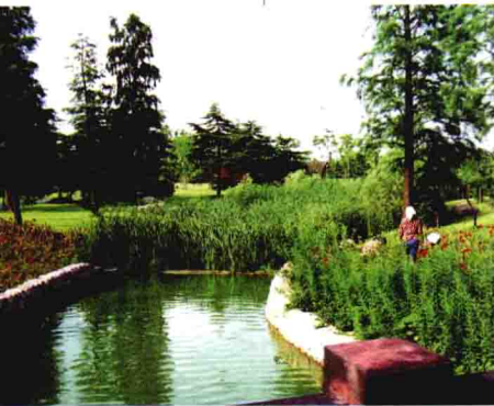
■美丽诱人的滨江森林公园