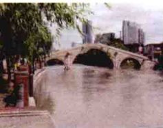
■高桥镇以境内一座桥梁而得名

渐形成的次生态景观和植物群落，内有沼泽湿地、芦苇丛、森林等多种生物环境。为了保护这些最“原始”的次生林，又能够让游客亲近自然，公园里特地铺设了木栈道，以方便游客穿越水系和林区。另外，还开辟了鸟道、鱼道和虫道，游客们在此能更亲密地接触大自然。