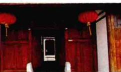
■清溪茶馆成了高桥人休闲的好去处

到西街，狭小的弹格路，两旁都是店铺，黑白白墙、圆形山头，屋脊一排黑色立瓦作鸟尾状微微翘起。西街重点参观“高桥人家陈列馆”，这以前是建于1918年的凌氏