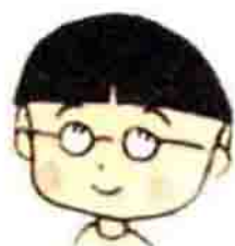
长山同学，聪明博学的少年。