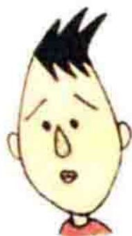
山根同学，经常肚子疼，性格认真。