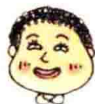
冬田同学，同样也是浪漫的少女。