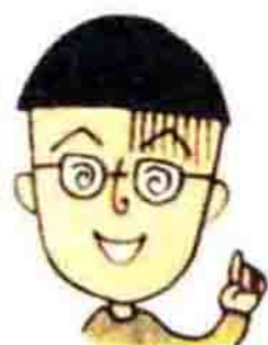
丸尾同学，班长，口头禅是“我猜得没错吧”。