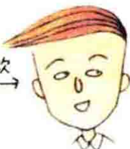
花轮同学，有钱人家的少爷。