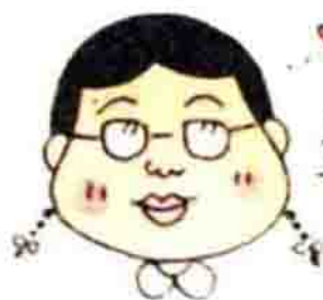
美环同学，相当浪漫的少女。