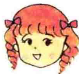
城崎同学，是个小美人儿。