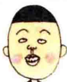
滨崎同学，容易得意忘形。