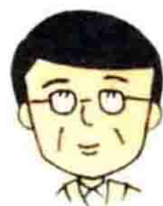
户川老师，小丸子的班主任，是个性情温厚的老师。