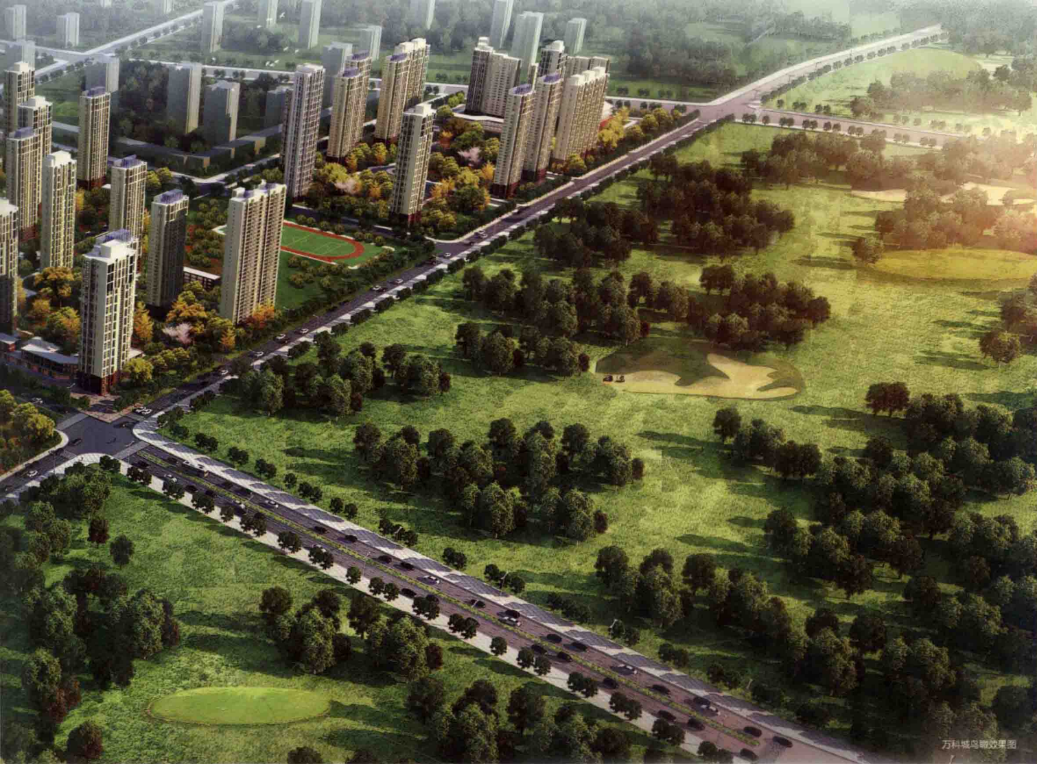
万科城鸟瞰效果图