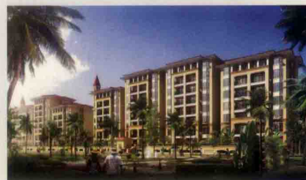
美兰高尔夫温泉别墅