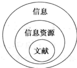
图 1-1 信息、信息资源、文献关系图

二是《中华人民共和国国家标准·文献著录总则》(GB 3792.1—2009)的定义:文献是记录有知识的一切载体。记录在文献上的信息资源最主要的特征是拥有不依赖于人的物质载体,只要这些载体没有损坏或消失,所记录的信息就可以跨越时空无限往复地为人类利用。文献信息资源是信息资源的一部分,因其便于传递、便于积累、便于整序,所以信息资源检索主要是对文献信息资源的检索。信息、信息资源、文献之间的关系如图1-1所示。