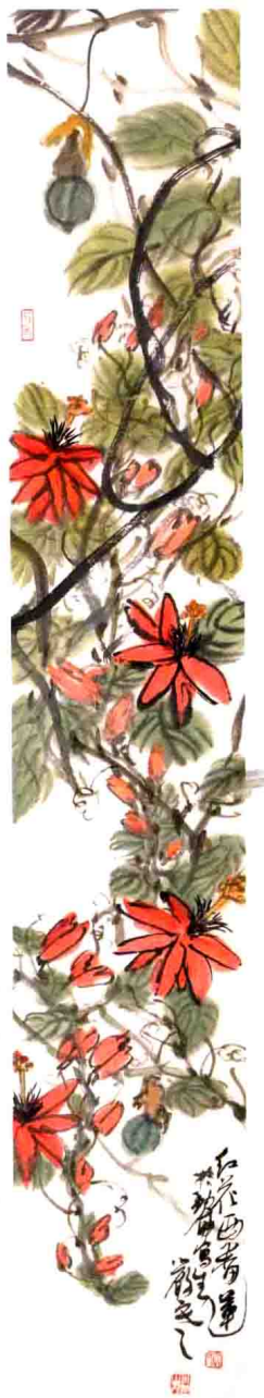
寫生花卉小四屏（之四） 23 cm × 138 cm