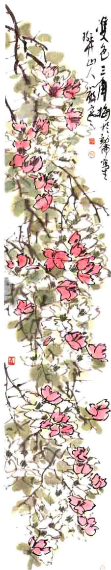
寫生花卉小四屏（之二） 23 cm × 138 cm