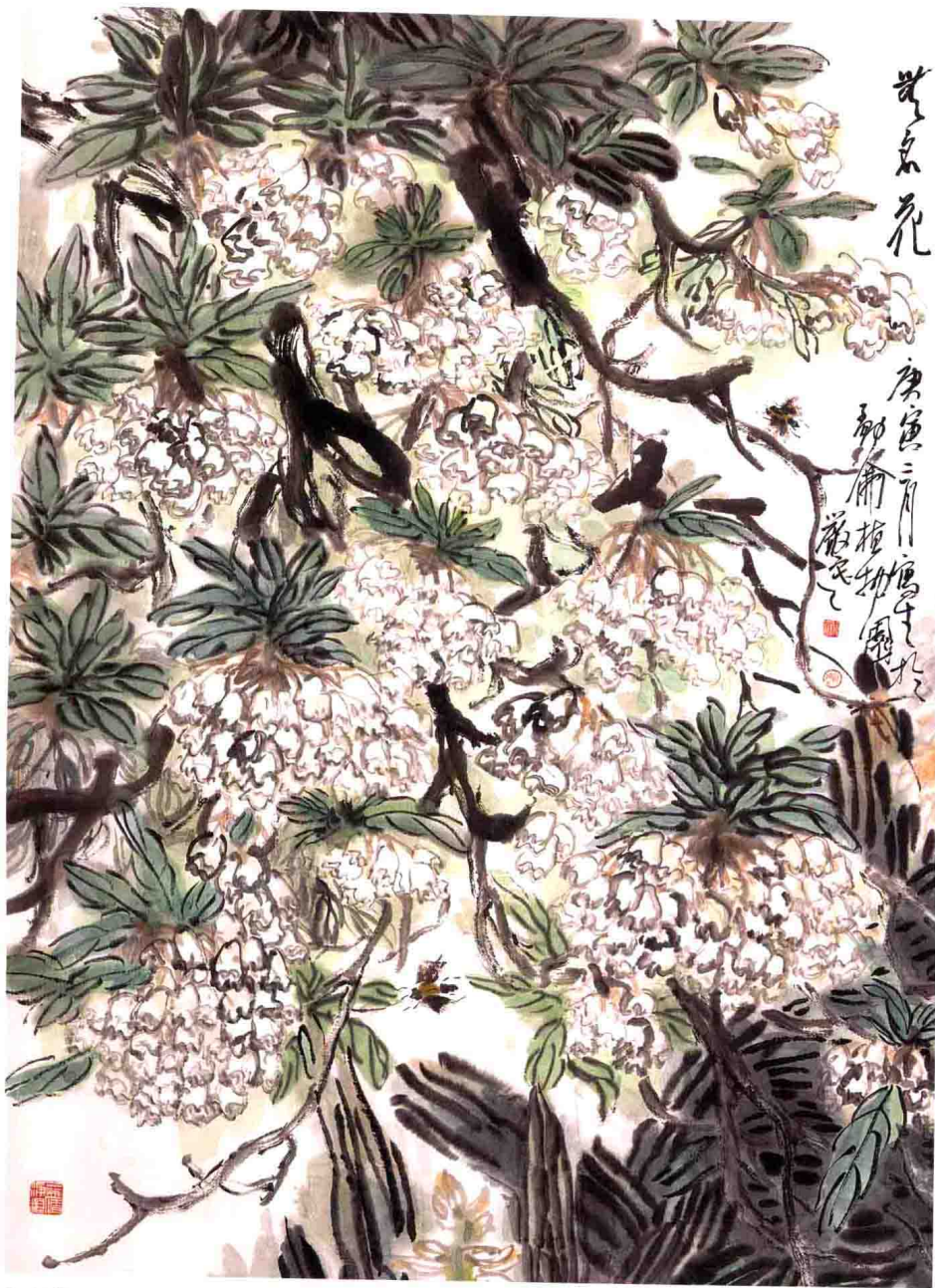
無名花 73 cm × 98 cm