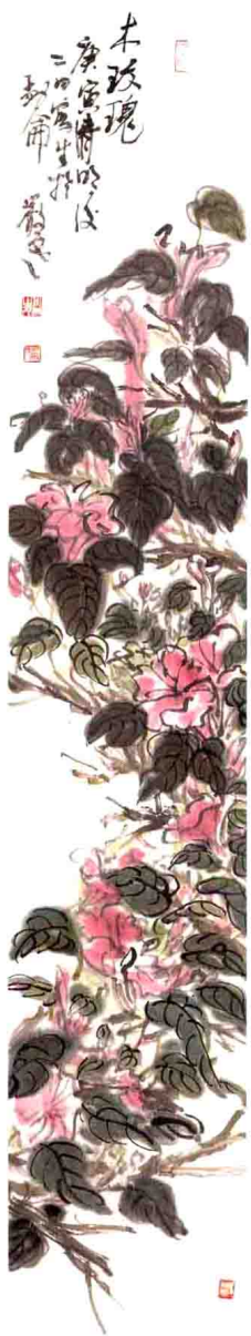
寫生花卉小四屏（之一） 23 cm × 138 cm