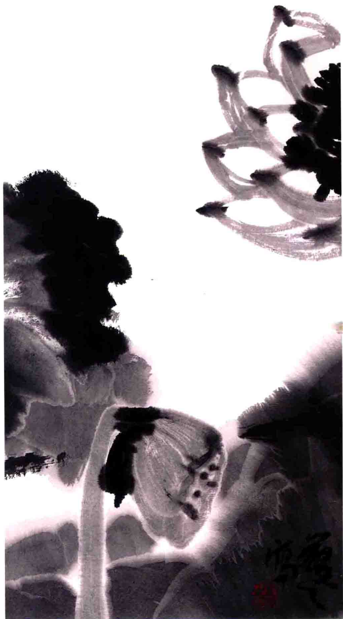
清溢 30 cm X 60 cm