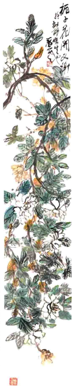
寫生花卉小四屏（之三） 23 cm × 138 cm