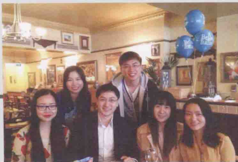
>> 与曾经的学生在一起 ▲