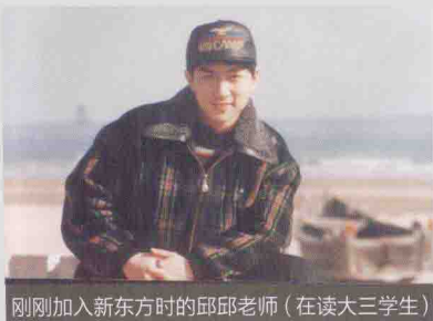
刚刚加入新东方时的邱邱老师（在读大三学生）