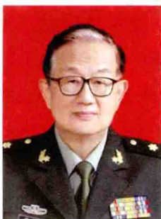
总主编 鞠 躬