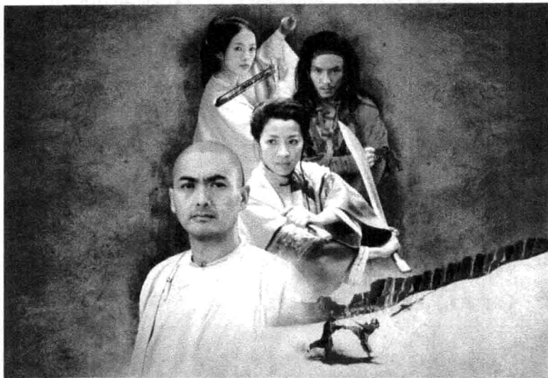
图2 《卧虎藏龙》, 《时代周刊》称赞该片“高超的艺术结合高度的精神, 令人狂喜的浪漫史诗。”