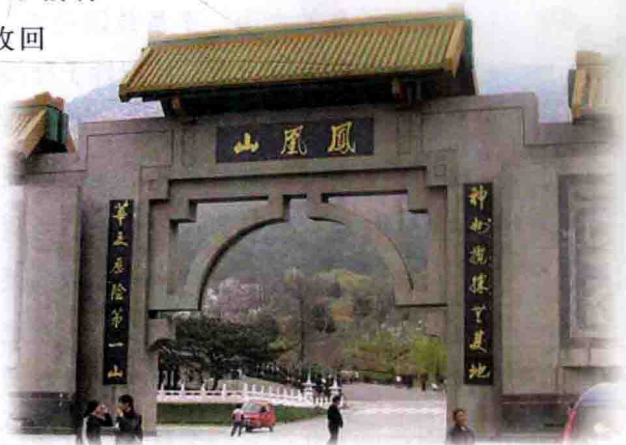
潮州凤凰山畚族祖地

一虫放在金盘内，日夜就会发毫光。朝内官兵来服侍，后来变成金龙相。金龙身长丈二三，身里青黄又花斑。身上花斑百二点，果然奇巧好名声。且讲当初金龙相，身上黑点又花黄。四脚落地变龙样，头尾奴龙一样