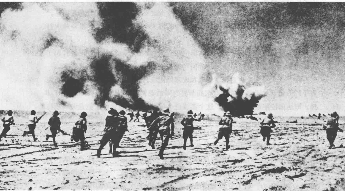
△ 1940年9月，意大利步兵在炮火的掩护下穿过西部沙漠攻击英军基地。