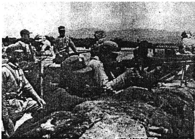
中国军队在卢沟桥抗击日军的进攻

“二·二六事件”后上台的广田内阁,完全听命于军部。8月,广田内阁制定了《国策大纲》,其基本内容是,大力发展军备,加紧对外扩张,“一方面确保帝国在东亚大陆的地位,另一方面向南洋发展。”根据这一方针,日本进一步加快战争准备的步伐。终于于1937年7月7日,发动了“七·七事变”,开始了全面侵略中国的战争。