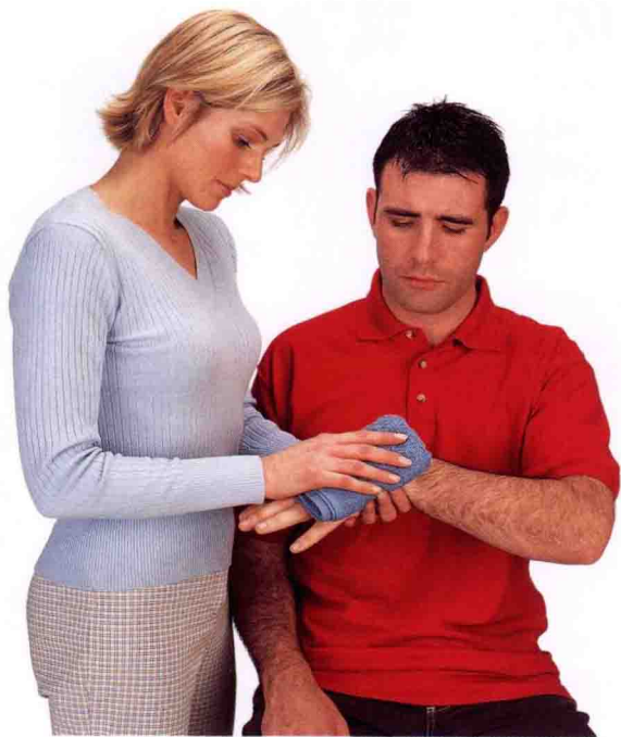
△ 为受伤的手临时包扎