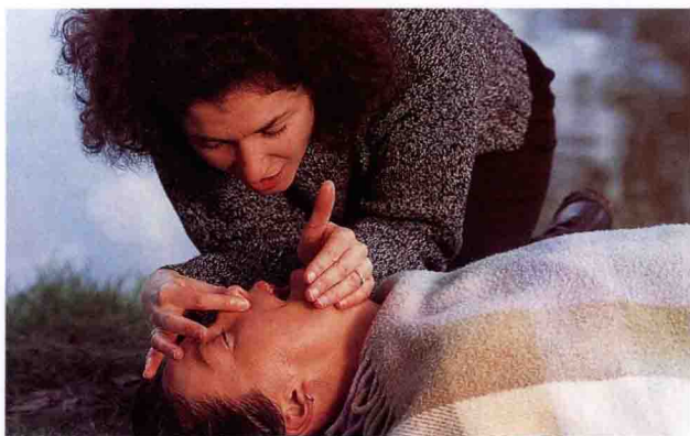
△ 为路边的伤员进行复苏