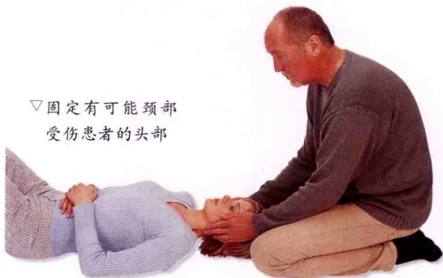
▽固定有可能颈部受伤患者的头部

2. 家庭成员日常服用的药物清单（老年人日常服用的药物种类尤其多），还要记录过敏药物，这对医生和急救人员非常有价值。