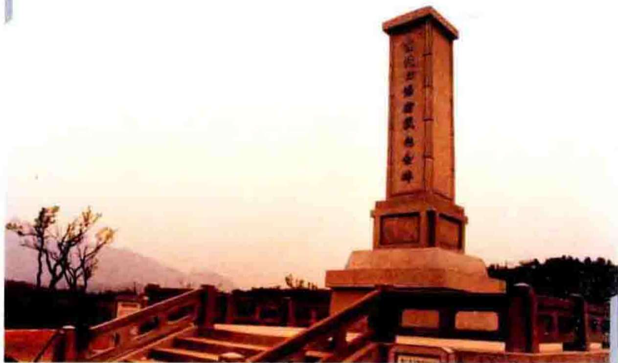
▲ 古北口保卫战纪念碑