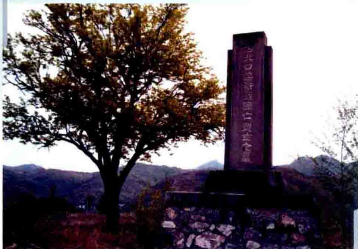
▲ 古北口保卫战阵亡烈士之墓