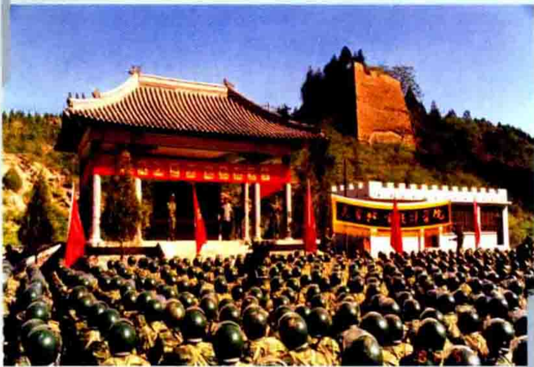
◀ 凭吊古北口抗日英烈