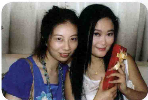
作者与深雪（右）合影